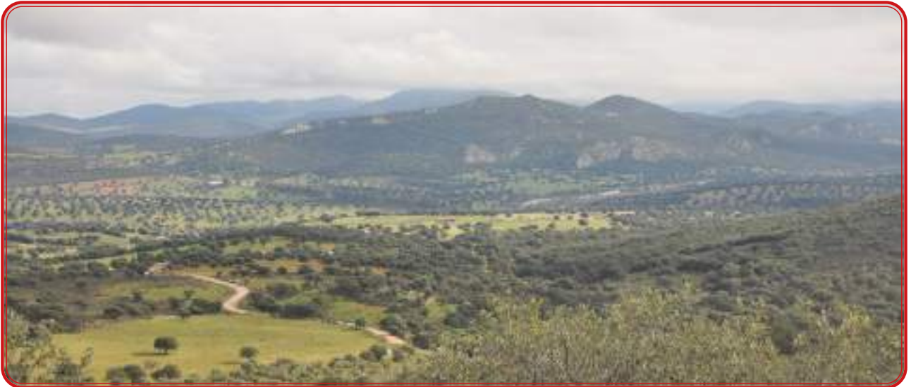
Valle del Guadalmez, en las cercanías de Santa Eufemia.

El clima de Los Pedroches es mediterráneo continental, con precipitaciones medias moderadas situadas entre los 500 y los 700 mm por año, con el máximo de lluvias en los meses de otoño e invierno y con una segunda temporada en primavera. Al igual que ocurre con el relieve, existe un cambio de incidencia de precipitaciones, más abundantes en el extremo oriental, con enclaves como la Venta del Charco, en Cardeña, donde la media supera los 900 mm año, casi el doble del área de Hinojosa del Duque, donde ese valor se sitúa en 450 mm año. Los indicadores, por tanto, van descendiendo de forma progresiva desde Cardeña hacia el límite con Extremadura. En cuanto a las temperaturas, las medias se sitúan en los 16 grados aunque la amplitud térmica es una de las características más destacadas de la comarca, con veranos de máximas superiores a 40 grados e inviernos con frecuentes heladas entre los meses de noviembre y marzo, cuando se alcanzan mínimas de hasta 4 y 5 grados negativos.