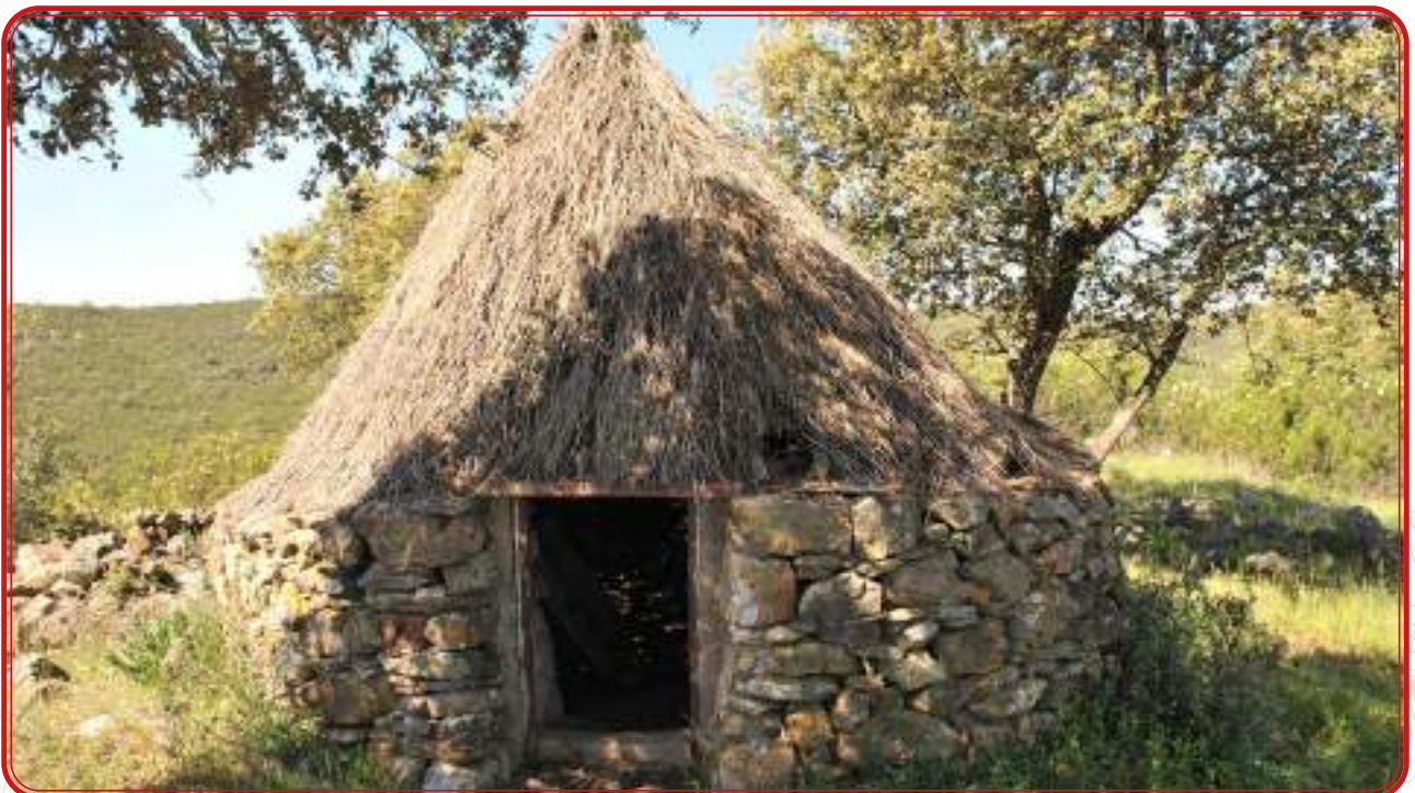
Muchos de los propietarios custodiaban el viñedo desde simples chozas.