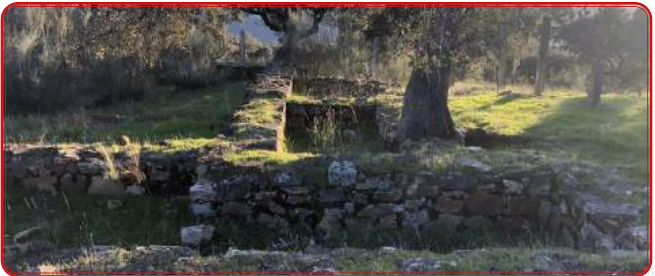
Restos de la basílica visigoda de El Germe, entre Espiel y Alcaracejos.

Tras la época romana, a principios de la Edad Media, las referencias a la producción del vino en la zona son escasas pero sabemos que los distintos templos tardoromanos, visigodos y, posteriormente, mozárabes contaron con lagares donde se elaboraba el vino. La arqueóloga Guadalupe Gómez Muñoz, en un artículo titulado Los mozárabes en la Sierra de Córdoba , hace referencia al constante hallazgo de lagaretas y de infraestructuras para elaborar vino en lugares de culto de la misma tipolo-