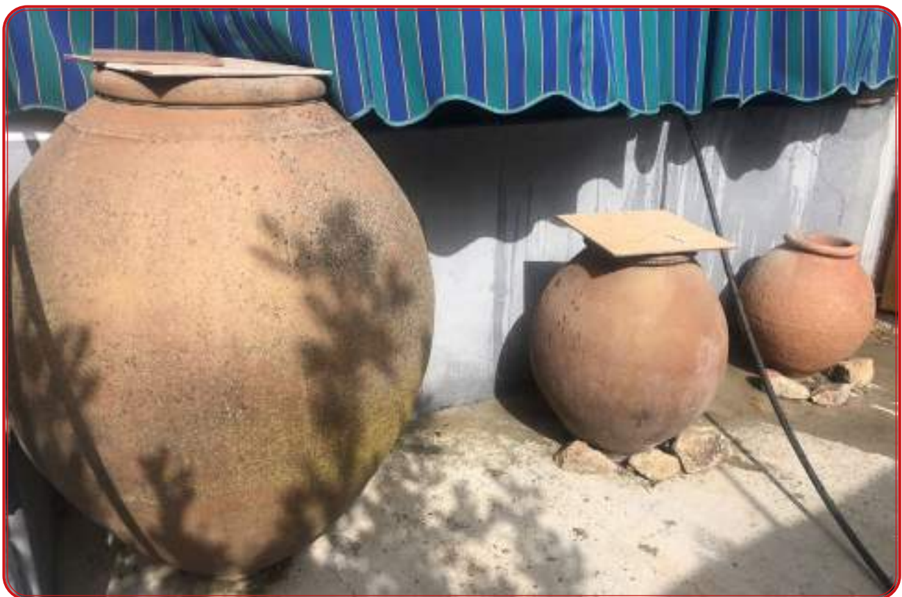
Casi todos los ruedos de Pedroche aparecían a finales del siglo XIX con viñedos y con huertas. Abajo, tinajas de fermentación en un domicilio de esta localidad.