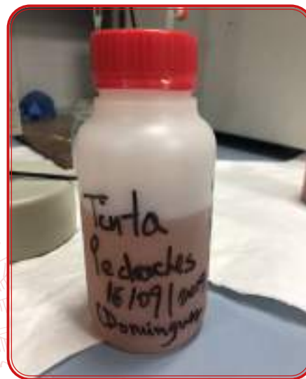
Identificación para vinificación en 2019.