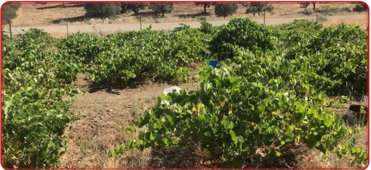
Pequeño viñedo de autoconsumo en Los Pedroches.

Desde este punto de vista, el trabajo tiene dos partes: la primera está dedicada a una recopilación de datos geográficos, históricos y cartográficos con los que se pretende ofrecer una radiografía de cómo se distribuía el viñedo de Los Pedroches y qué características tenía el vino de la zona. Con respecto a ello, encontramos que el cultivo de la vid lo heredan en parte de los musulmanes los primeros pobladores cristianos de la zona. Los pagos de viñas van creciendo conforme aumenta la población y, al igual que ocurre en otras zonas como La Mancha o Extremadura, entre los siglos XVI y XVII se configura un viñedo que alcanza más de 3.000 hectáreas en su punto álgido. En el siglo XVIII comienza el declive y en el XIX se va apostando por el olivar conforme avanzan las roturaciones de las zonas más montuosas y tras las desamortizaciones. La plaga de la filoxera es el final pero no debemos verla como la única causa. A partir de ahí las viñas quedan relegadas a huertas, linderos, emparrados y zonas abandonadas. Eso hace que se mantengan como en una cápsula del tiempo vegetal porque a juzgar por los resultados del estudio que estamos realizando existe una serie de variedades autóctonas considerable. Todas las citas de autores, documentación, libros y testimonios orales se han incorporado al texto, eliminándose los pies de página, para facilitar la lectura del mismo a un amplio perfil de lectores.