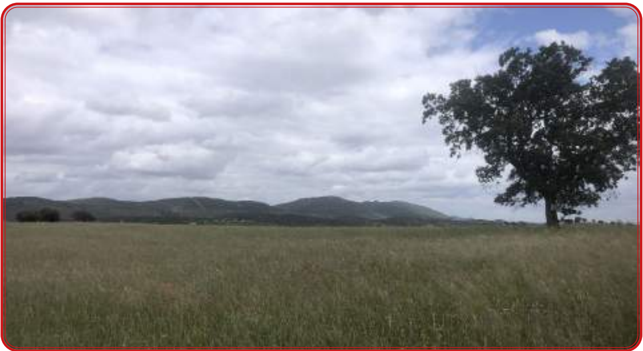
Foto de la zona desarbolada de Nava de Vacas. Al fondo, el Alcanfor y la Chimorra.

La economía de villas como las de Los Pedroches en el siglo XVII se centra en una agricultura y en una ganadería casi de subsistencia. Hay poco espacio para la generación de rentas producto de las ventas de excedente. En una zona tan apartada de los centros de decisión y de las rutas comerciales, los vecinos dependen para su sustento de las producciones propias. En el siglo XVII apenas se importaba aceite, el vino que se consumía era de procedencia local y si se vendían artículos fuera eran los vinculados a ganado, sobre todo cerdos y ovinos. Es por ello que al tiempo que la población crece se busca con urgencia tierra que cultivar. Un ejemplo de ello aparece en el pago de viñas que