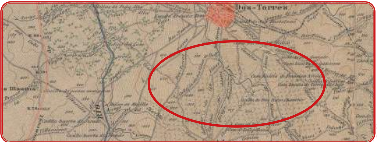
El viñedo de Dos Torres, compartido con Añora tradicionalmente. Mapa de 1889.

A mediados del siglo XVIII, según el Catastro de Ensenada, Torremilano contaba con 701 hectáreas de viñedo, una cifra que consideramos elevada, como ya hemos apuntado anteriormente. Pero sin duda, el pago de viñas que aparece en las minutas cartográficas entre esta localidad y Añora debió ser considerable. Casas Deza los refleja como “muchos viñedos de inferior calidad, los cuales están cercados y algunos tienen casa”. Sus pagos están sobre suelo granítico en su totalidad.