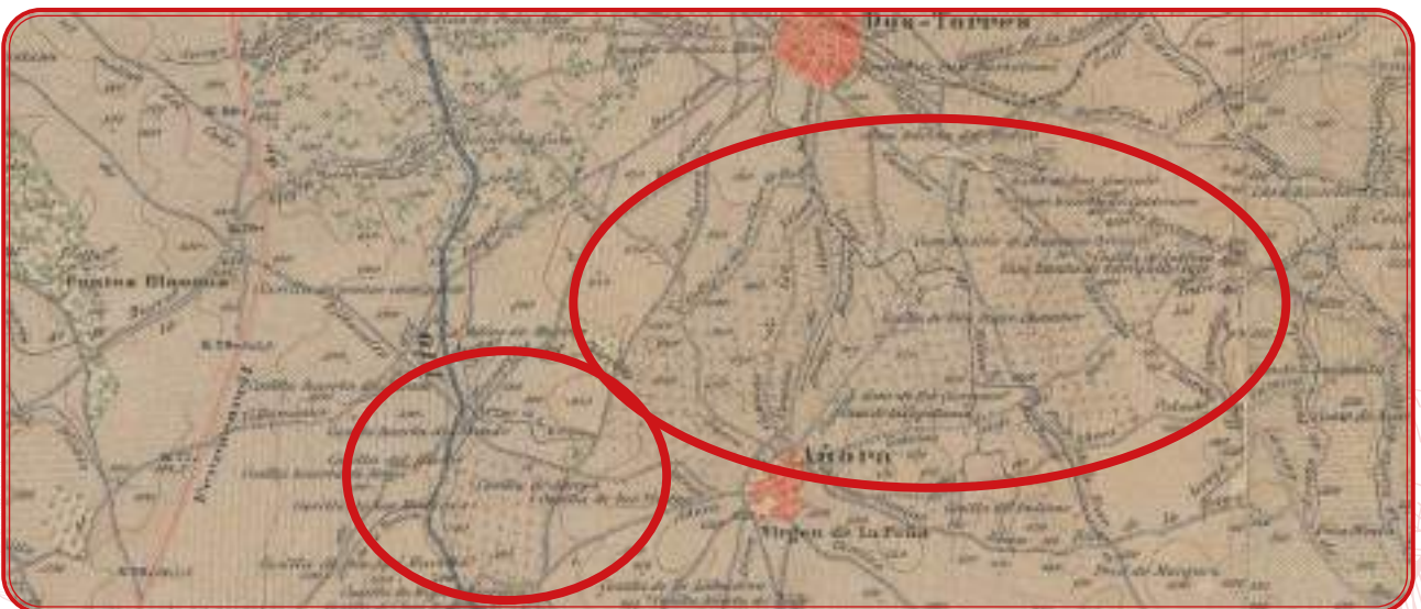
Pagos de Añora y Dos Torres. La zona del oeste del casco urbano aún se conoce como las viñas. Mapa del año 1889.

La tradición dicta que el nacimiento de esta villa está vinculada a la huerta y al pago de viñas que cultivaban los vecinos de Torremilano en una zona en la que aún hoy se aprecian vestigios de aquel cultivo en las paredes de piedra de las huertas y en zonas aisladas protegidas del ganado. El principal pago de viñedo de Añora se situaba en la carretera de Dos Torres y en el entorno del Guadarramilla, en el límite con el término de Alcaracejos. La zona noroccidental del casco urbano se sigue denominando paraje de Las Viñas.