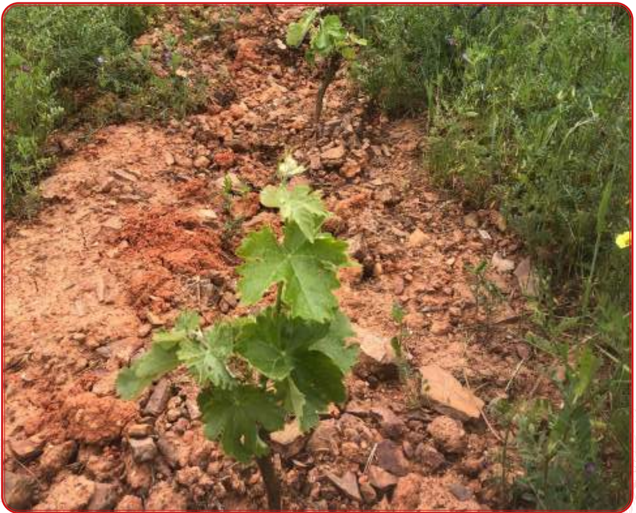
Nueva plantación de viñedo con autorización en Los Pedroches.