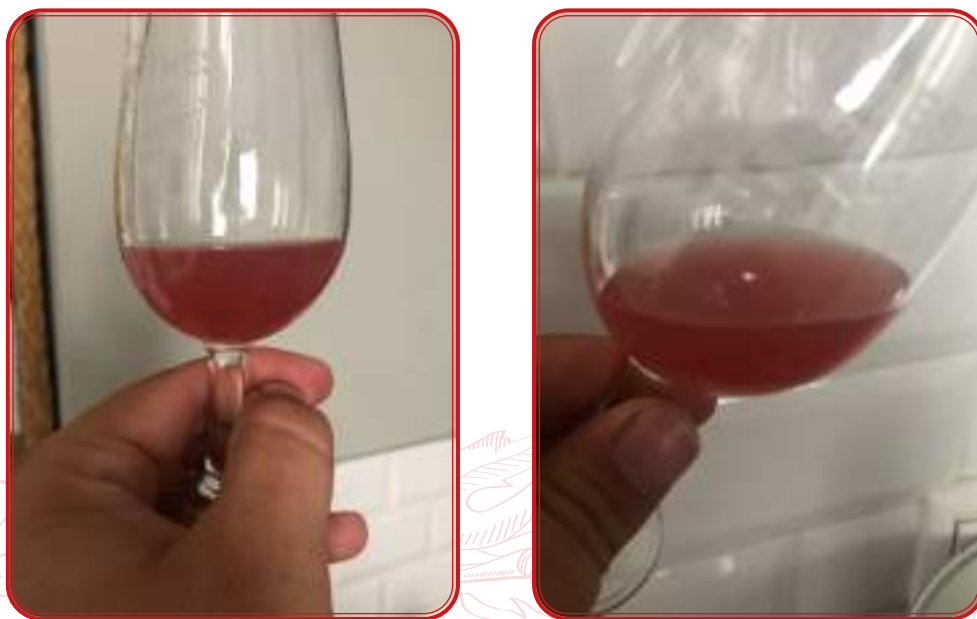
Vino de tonalidad tinta clara, elaborado con uvas de variedad por identificar.

El Cartagenero compra un molino de aceite, según relata Baroja, pero las cosas le empiezan a ir mal en la venta por distintos motivos y “ya no se encontraba el buen vino de antes, por lo que los arrieros dejan de acudir”. Baroja pondera por tanto la calidad del vino y cita a los arrieros, un oficio vital para el desarrollo de la Sierra en aquellos años. De El Cartagenero, la venta pasa a un hombre conocido como El Mojoso, “un granjero de por allí”. Y el Mojoso, de lo primero, que se preocupa es de que haya buen vino en la venta: “El vino en los primeros meses era puro, y había un pardillo y un clarete que hacía ya muchos años que se no se conocían por allí”.