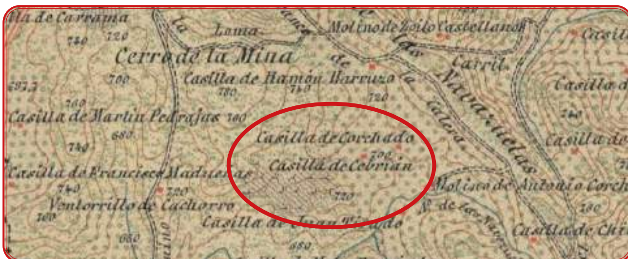
Pagos de viñas de Alcaracejos. Arriba, el Calatraveño. Abajo, el entorno del casco urbano. Mapa del año 1889. Nota: El símbolo de la vid es una estrella de tres puntas.

Alcaracejos fue uno de los municipios con más tradición vitivinícola de la comarca. Contó con importantes pagos de viña y es uno de los municipios donde hemos tomado más muestras para hallar variedades autóctonas. Prácticamente todo el entorno del casco urbano estaba plantado de viña. Destacan la zona de la carretera N-502 hacia El Viso y la carretera de Villanueva del Duque, donde se unen los términos de los dos municipios. Por referencias orales sabemos que el entorno del Calatraveño, por el Barranco de La Calera y por la loma de Las Navezuelas, fue un pago de viña y, según Ramírez de las Casas Deza, en el Alcanfor, la zona de la solana del término de Alcaracejos ubicada entre el citado puerto y La Chimorra, tuvo un plantío de viñas en el siglo XIX de 400.000 pies, algo extraño porque el cultivo ya no gozaba de la predilección de los vecinos. Como elementos constructivos, cabe destacar la existencia de una bodega de tinajas en el actual cortijo del Alcanfor y de un pequeño molino de aceite y lagareta ubicada en el Barranco de La Calera, que tuvo carácter comunitario. Este paraje, la Venta de Vegas y la Nava estuvieron completamente plantados de viña y sumaban en torno a 1.200 fanegas de viña. Las apreciaciones sobre este espacio se citan en el apartado dedicado a Pozoblanco, por ser los vecinos de esta localidad los que las explotaban mayoritariamente, y en las referencias al viñedo de la comarca en los siglos XVII y XVIII.