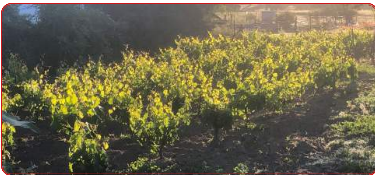
Pequeño viñedo de autoconsumo en el término de Añora.

Ramírez de las Casas Deza, en su Corografía del Obispado de la Provincia de Córdoba , datado en 1840, una obra que ofrece algunas de las escasas referencias publicadas sobre la situación del viñedo de Los Pedroches justo en el momento del inicio de su declive, expresa en cada uno de los capítulos referidos a las poblaciones de la comarca cómo el vino se había convertido en un producto de autoconsumo y excepto en casos aislado se vendía fuera de las villas.