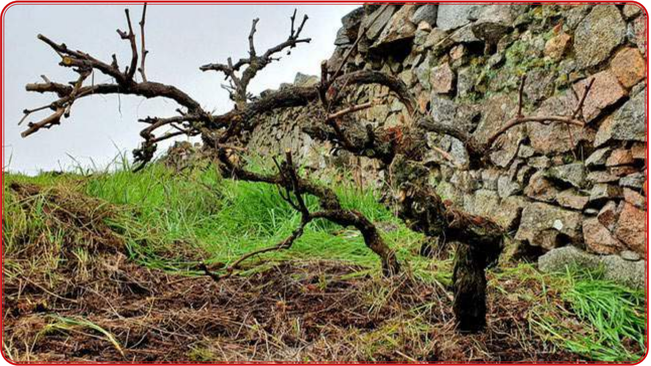
Viña centenaria en una pared de piedra de Añora.