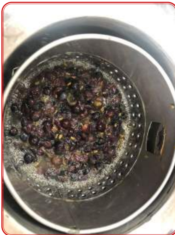
Proceso de vinificación: fermentación y análisis previos.