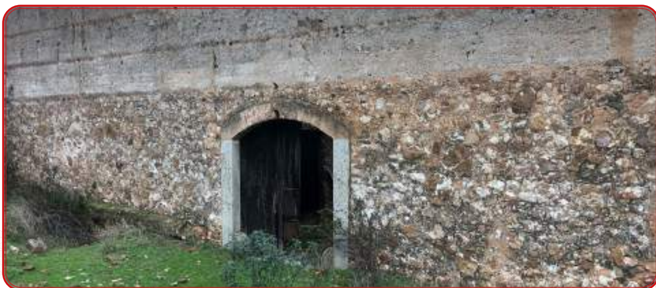
Lagar de la Huerta de Los Leones, entre Villanueva del Duque y Belmez. Es uno de los conjuntos de lagar más destacables del norte de la provincia.