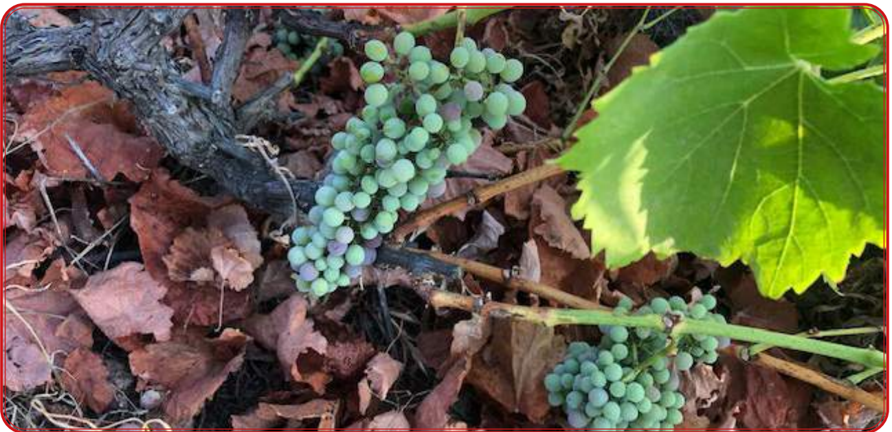
Envero de una variedad local por identificar.

La imagen que refleja Loma Rubio según distinta documentación recogida en el Archivo Histórico Provincial de Córdoba coincide con otros documentos que hemos tratado como el artículo de García de Los Salmones en las actas del Congreso de Viticultura de Pamplona 1912 en referencia a las variedades del norte de Córdoba, donde se cultivaban las blancas aris, piñuela, palomino y jaén; y las tintas: piñuelo, temprana negra, castellana, mollar y rompetinajas. La presencia de variedades tintas, hoy prácticamente perdidas, explica una singularidad que parece más que contrastada sobre la presencia de vinos tintos de la comarca. De hecho, como se apreciará en la segunda parte de este trabajo, una de las variedades autóctonas que hemos encontrado con mayor profusión es la tinta que ya hemos citado y que denominamos provisionalmente como amparo.