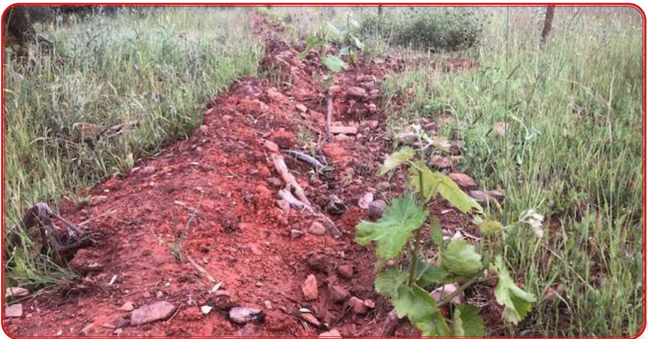
Vides injertadas con la variedad local amparo.

Pero como apuntábamos, en 2016, el sistema de derechos se sustituyó por uno de autorizaciones: es obligatorio contar con una concesión administrativa que es intransferible, que no puede ser vendida y que además tiene una caducidad de tres años. Aunque hay vacíos legales que permiten plantar el viñedo mediante acuerdos de arrendamiento entre agricultores, actualmente la única forma de acceder a estas autorizaciones es solicitar la plantación con acuerdo a las reservas que cada año saca a concesión la Comisión Europea. Así, cada estado miembro de la UE puede permitir el aumento de hasta el 1% de su superficie actual de viñedo y ponerlo a disposición de nuevas plantaciones. En este sentido, las comunidades autónomas abren la posibilidad de optar a esta reserva entre enero y el 28 de febrero. Las concesiones se comunican en septiembre, con lo que hasta la primavera siguiente no se podría plantar. Aunque el objetivo de este trabajo no es abundar en aspectos legales, sí hemos querido dejar claras las limitaciones que existen a la hora de apostar por este cultivo.