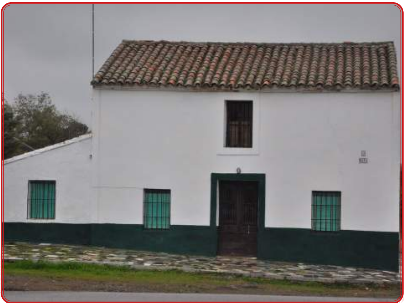
Venta de La Maña, en el corazón de la antigua Dehesa de la Concordia.

Desde el punto de vista de organización territorial, la comarca queda configurada tres áreas históricas a las que ya nos hemos referido y cuya vigencia se prolonga durante toda la Edad Moderna: Condado de Belalcázar (Belalcázar, Fuente La Lancha, Hinojosa del Duque y Villanueva del Duque), Señorío de Santa Eufemia (Santa Eufemia, El Viso, El Guijo y Torre Franca) y las Siete Villas de Los Pedroches (Pedroche, Torremilano, Torrecampo, Pozoblanco, Alcaracejos, Villanueva de Córdoba y Añora), territorio este último adscrito a la Corona de Castilla excepto entre 1660 y 1747, tiempo en el permanecieron sujetas al Marquesado de El Carpio. Esta organización territorial tiene su incidencia en la administración de las tierras y de la agricultura y la ganadería.