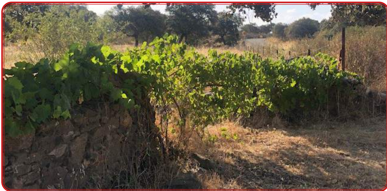
Restos de viña, una blanca y otra tinta, en las faldas del Calatraveño.