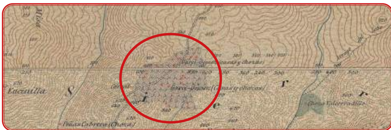
Antiguos viñedos de Garci-Gómez (arriba) y de Mañuelas (abajo).