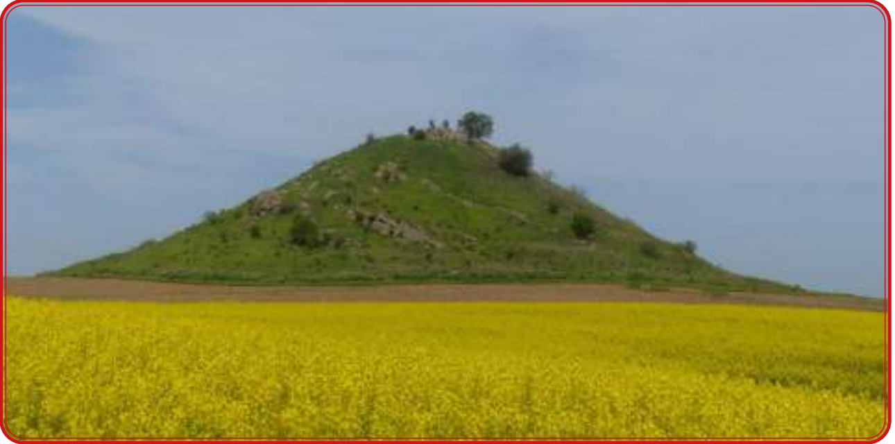
Cerro de Masatrigo, donde se sitúa la ciudad romana de Mellaria, en Fuente Obejuna.

rras del norte cordobés. Minas y agricultura conformaron ya un binomio que ha sido el santo y seña del desarrollo de Los Pedroches y el Alto Guadiato hasta prácticamente la primera mitad de s. XX. En ese tiempo, existió un poblamiento en cerros de media altura asociados con las minas y cultivos desarrollados en los cauces fluviales ante los que se disponían los asentamientos, que configuraban un paisaje cada vez más creciente en articulación logística.