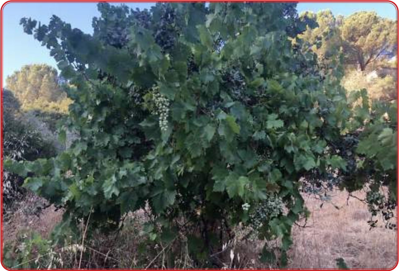
Pedro ximénez en una zona de huertas del Barranco de La Calera, en Alcaracejos.

-Pedro ximénez. Encontrada en un olivar del Puerto Calatraveño entre los olivos y en un arroyo. Todo apunta a que esta variedad aparece en la zona por un intento de recuperación del cultivo en la zona del Barranco de la Calera durante los años 50. Esa zona fue viñedo y enlazaba con el pago de las Navezuelas y el hecho de que se plantara pedro ximénez se debe a la extensión de la variedad en los años 50 y 60.