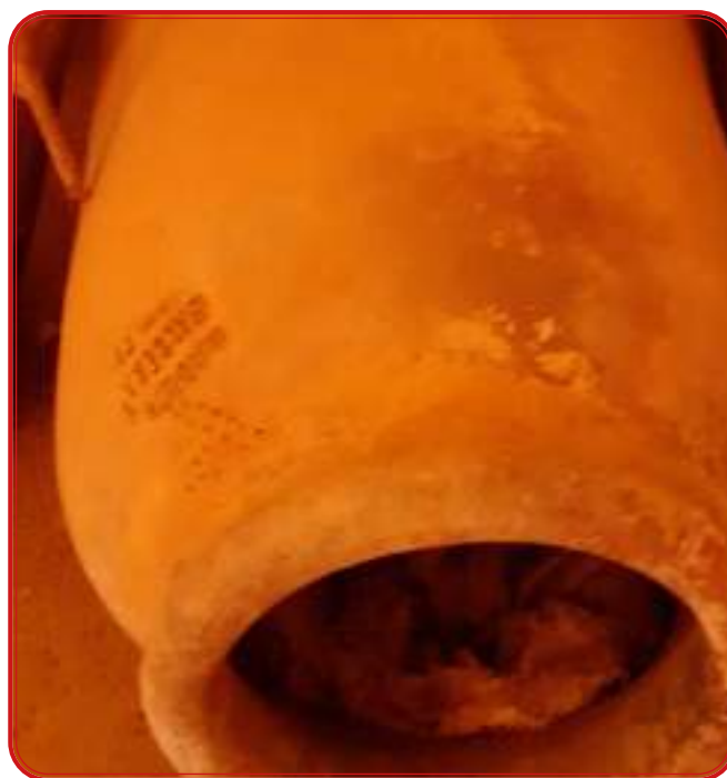
Tinaja de fermentación en un lagar de la Sierra.