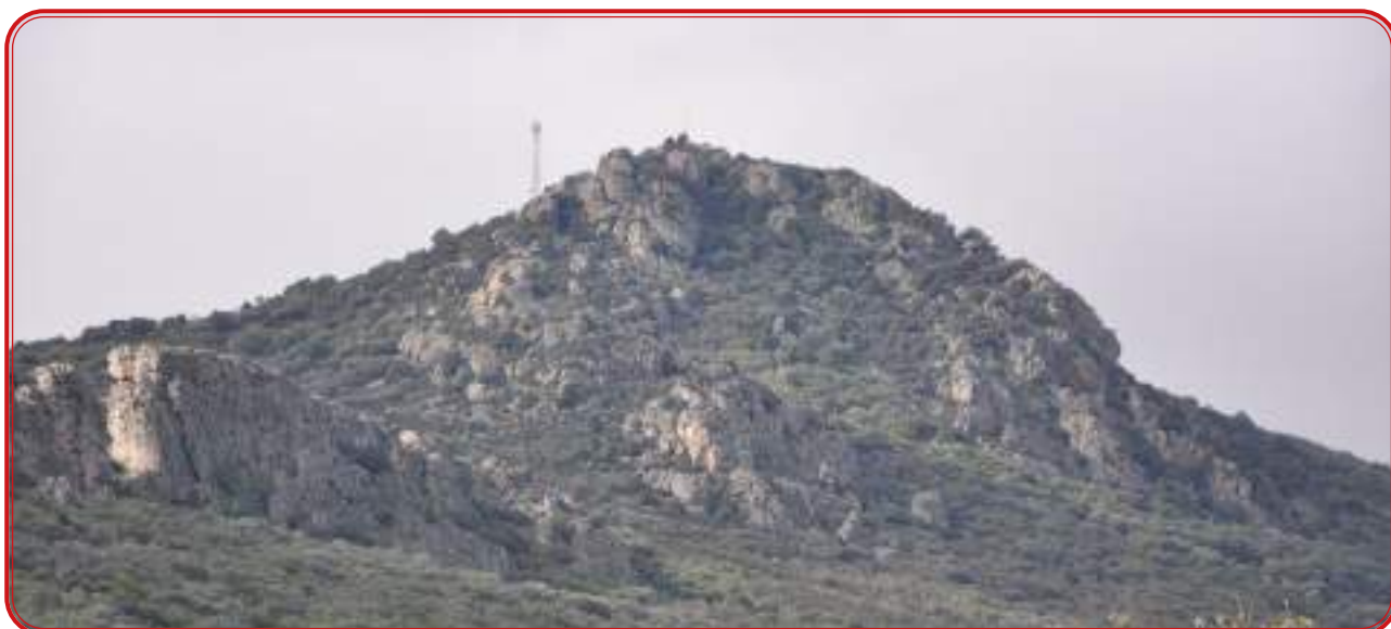
Cresta de cuarcita de la Sierra de Santa Eufemia.