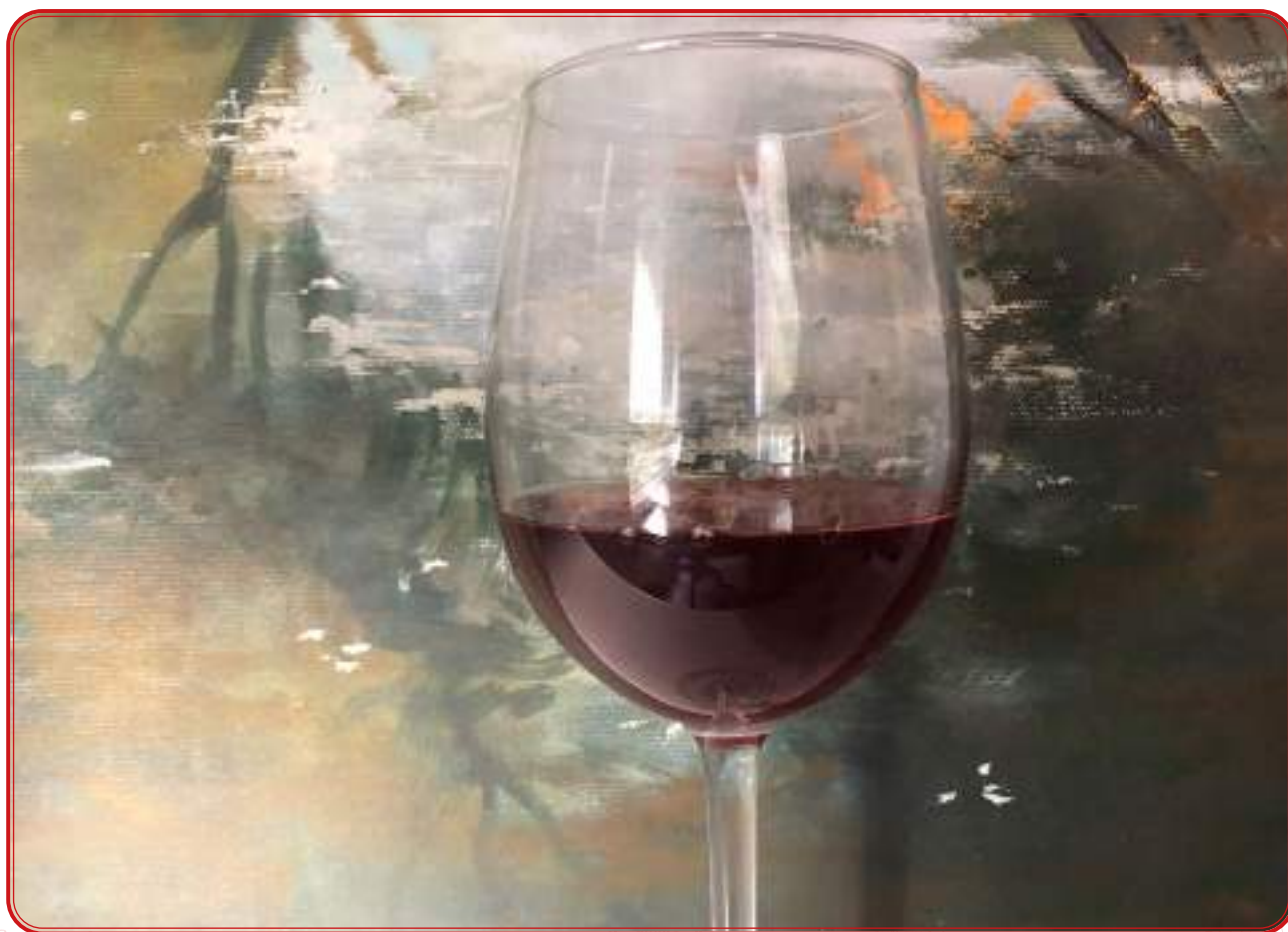
Vino elaborado en 2020 con uvas de variedad amparo y schiava grossa.

-Schiava Grossa. Tras uno de los testimonios orales recabados para el presente trabajo, se acudió a una vivienda de Alcaracejos para registrar una parra de uvas tintas. Esperando encontrar uvas de la variedad que se ha denominado como amparo, apreciamos unas uvas de mayor grosor y tonos distintos, mucho más oscuros. El análisis de ADN desveló que pertenecen a la variedad schiava grossa, una uva muy antigua cultivada en el Tirol y en el Trentino, regiones ubicadas entre Italia y Alemania. La parra, según los propietarios de la vivienda puede tener más de 100 años. Nuestra teoría sobre este hallazgo es que la planta llegara de la mano de personas vinculadas a la explotación de las minas de Alcaracejos a finales del siglo XIX o principios del XX. Distintas fuentes orales nos confirman igualmente que no era infrecuente que ingenieros y personal formado vinculado a la minería trajera variedades procedentes de sus países. Precisamente, en la denominada Huerta de Los Leones, (ver página 36), en Belmez, hemos encontrado una variedad de vid con perfil único, que podría provenir de Francia.