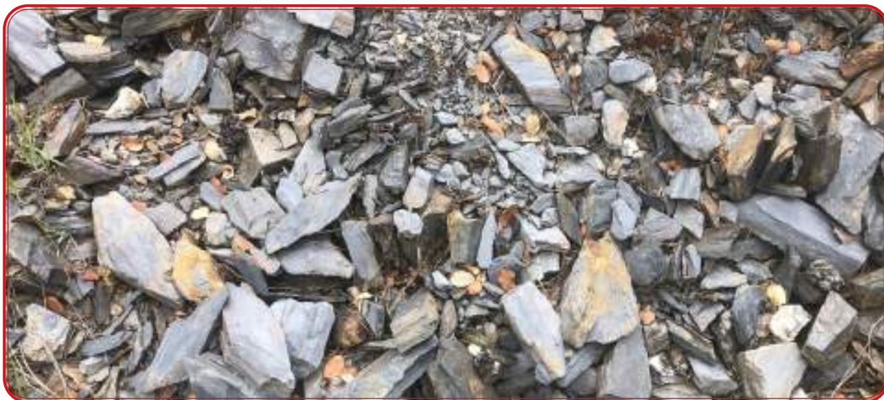
Conglomerado de pizarra de Los Pedroches.