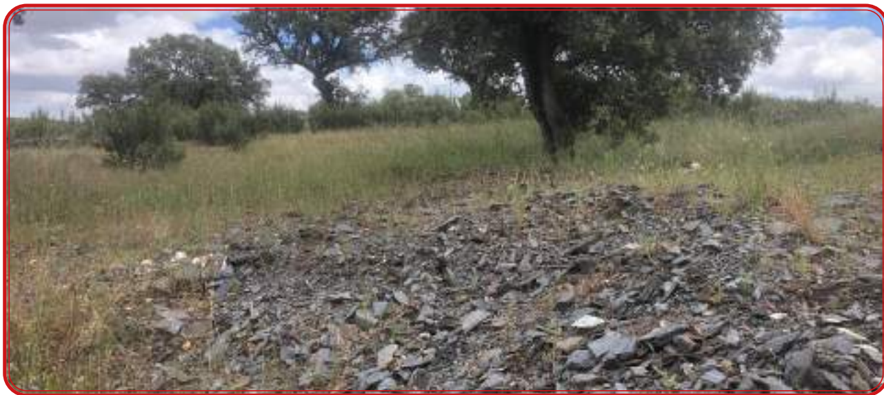
Afloramientos de pizarra en una dehesa.

cuarcita. Incluso, el acervo popular, en municipios como Villanueva de Córdoba, identifican la suma de estos espacios como la saliega (granito) y la pizarra (Sierra). Es más, en esta localidad, desde hace más de 200 años, se denomina pizarreros a las personas que se asentaron en la Sierra para descuajar el monte y cultivar olivar y viña. En otras localidades como Pozoblanco o Alcaracejos establecen un tercer concepto: serrezuela y jarales, respectivamente, para definir las zonas de pizarra.