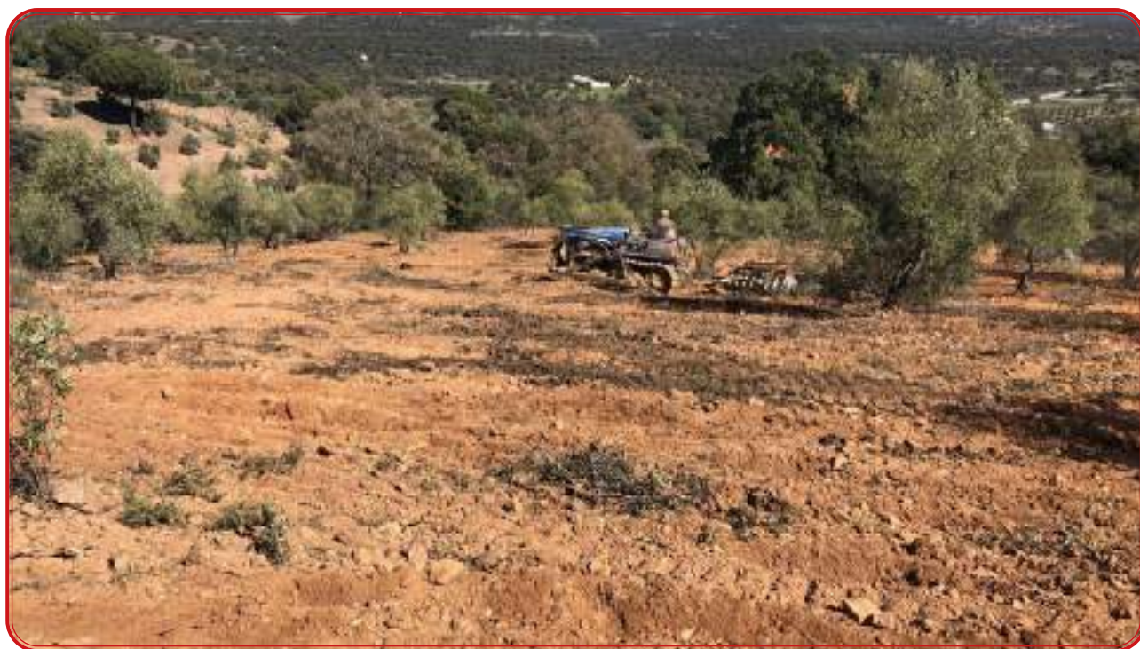
Desmante para de viñedo sobre un suelo ácido que debe ser mejorado. Ph: 5,5.

Aunque hemos abordado los aspectos geográficos de la comarca de Los Pedroches al principio de este trabajo, consideramos importante revisar, aunque sea de forma resumida, algunas consideraciones desde el punto de vista agronómico acerca de la capacidad de los suelos de la comarca para la plantación de viñedos. Como se fijaba en el epígrafe xx de este trabajo, en Los Pedroches podemos hacer una catalogación de tres tipos de suelos: tierras pardas meridionales sobre granitos (el relieve llano de la comarca), tierras pardas meridionales sobre pizarras (serrezuelas y jarales) y suelos rojos, tierras pardas meridionales sobre pizarras esquistos y cuarcitas.