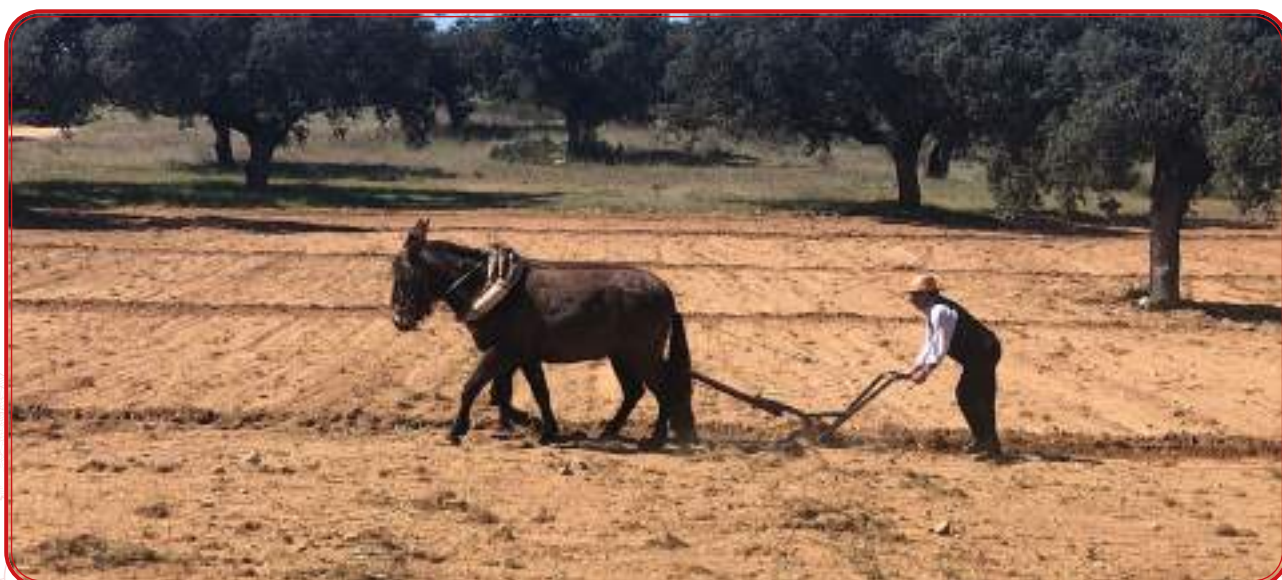
Labor con bestias en una dehesa granítica.