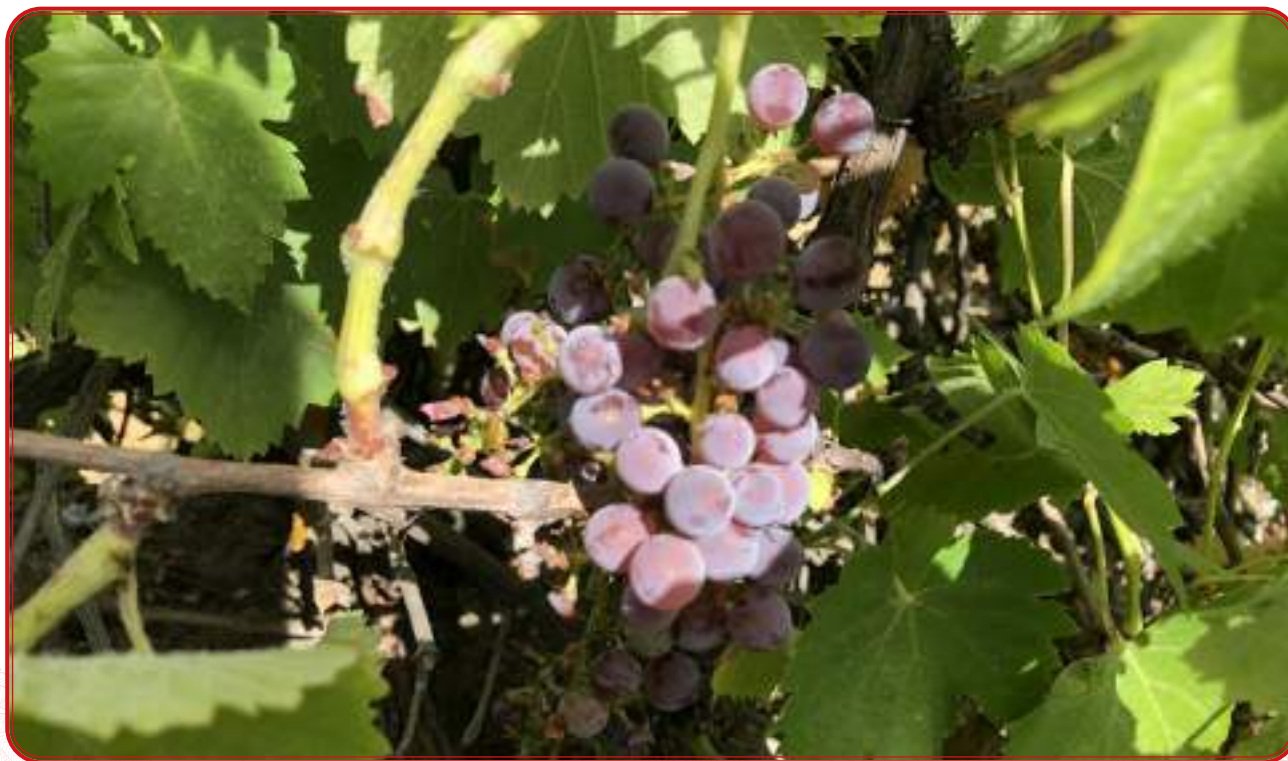
Uvas tintas de variedad local amparo.

La recogida de muestras de hojas de vid para su análisis genético debe realizarse entre la primavera y el verano. Comenzamos el muestreo en 2019 con una serie de criterios preestablecidos que se