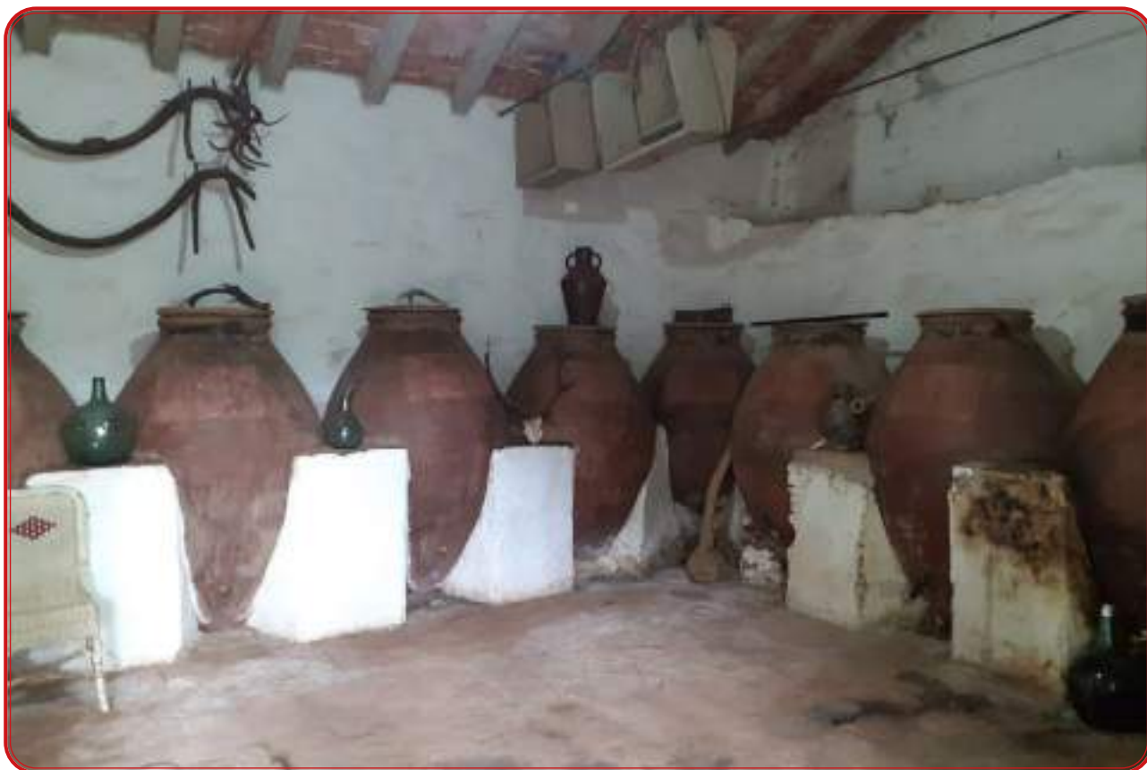
Lagar de El Cañaverál, término de Pozoblanco.

más amplios, es evidente que los vecinos de Pozoblanco siempre prefirieron cuidar de sus viñedos en la Sierra. En cuanto a las viñas cercanas al casco urbano, se cultivaban en todo el entorno de San Antonio en dirección a la zona de El Silo y La Salchi (Mimbreras) y en la zona ubicada tras el actual polígono industrial de La Emiliana (Cañada Honda). Por referencias orales y trabajo de campo, sabemos que las fincas de Pedrique y El Cañaverál, cuyos caseríos fueron lagares, en el extremo sur del término pozoalbense, contaron con destacables viñedos. También la zona del Llano del Platero, junto al río Cuzna, en la carretera de Villaharta, donde también existió un lagar, estuvo plantada de viñas. Por las minutas cartográficas y por comprobaciones sobre el terreno tenemos constancia de la existencia de un amplio viñedo en el paraje de Los Llanos de Villaharta, también en el extremo sur del término.