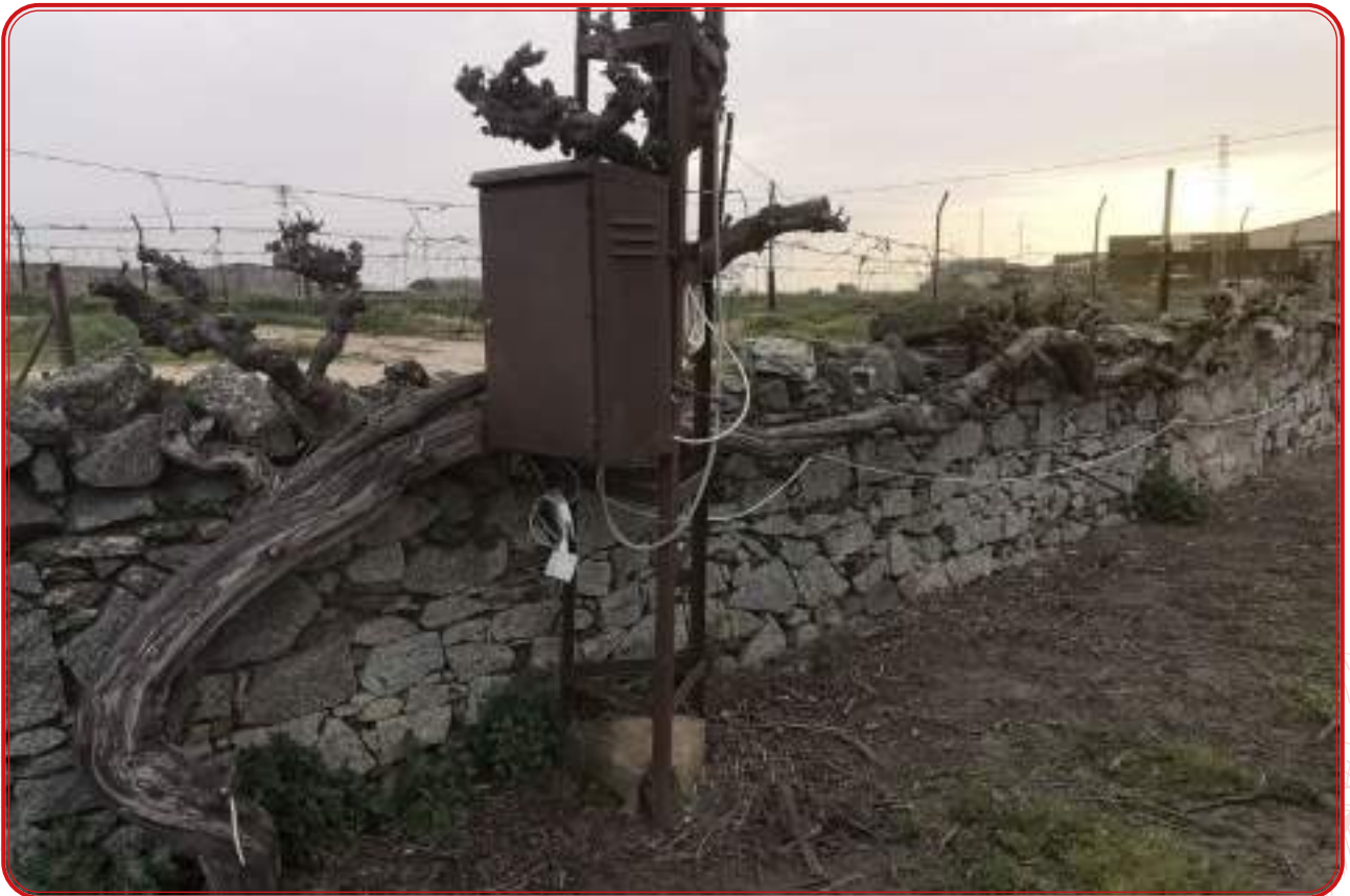
Parra centenaria de la variedad jarrosuelto en Alcaracejos.