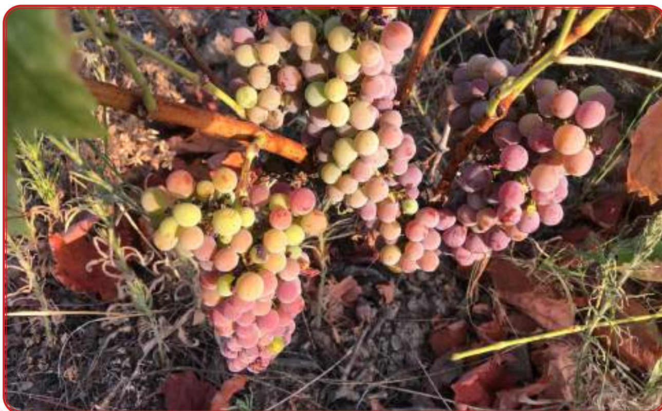
Envero de variedad local amparo.

Las uvas tintas de Pedroche resultaron ser autóctonas y otras blancas que aparecían en la misma finca también. Nuestra prioridad entonces fue buscar uvas similares. Las tintas las encontramos en Pedroche, en el entorno de Alcaracejos, en Añora y en el Puerto Calatraveño. Las blancas con el mismo perfil genético único las encontramos en Pozoblanco, Añora y Pedroche. Que las analíticas de Gonzaga Santesteban nos mostraran los mismos perfiles en parras que se encontraban a 30 kilómetros de distancia quiere decir que “existe una intencionalidad en la plantación” y descarta la posibilidad de hibridaciones puntuales o de alteraciones del perfil genético.