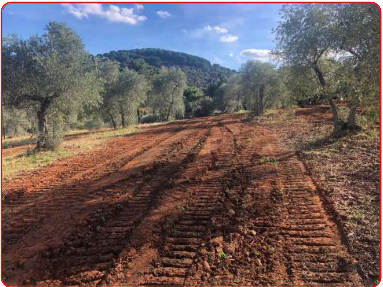
Una de las alternativas del viñedo en la zona reside en aprovechar las calles más anchas del olivar.

Y por último, cabe destacar la importancia de recuperar una parte de nuestro legado, de nuestro patrimonio cultural, de elementos que formaron parte del paisaje y que por distintas circunstancias han desaparecido. Este legado histórico constituye además un elemento de promoción muy importante porque confiere, como se apuntaba, elementos exclusivos a un territorio como Los Pedroches.