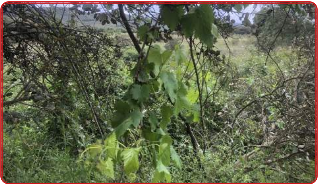
Emparrado de variedad desconocida entre las zarzas del Arroyo del Lorito.

Como se ha apuntado anteriormente, los vecinos de Pozoblanco tuvieron un protagonismo destacado en el cultivo de Nava de Vacas, que pudo ser uno de los pagos de viñas más importantes del Reino de Córdoba. La documentación existente al respecto es abundante y refleja el interés que se tiene en esta villa por esta actividad agraria, ya que incluso se llega a intentar que todo el pago pase a formar parte del ámbito territorial de las Siete Villas de Los Pedroches. Un documento fechado en Pozoblanco el 30 de diciembre de 1674 refleja la importancia y la actividad de los habitantes de la