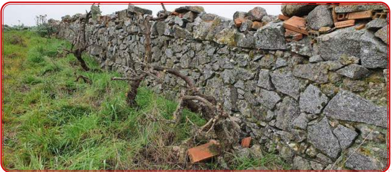
Cepas centenarias en el paraje Las Viñas, de Añora.