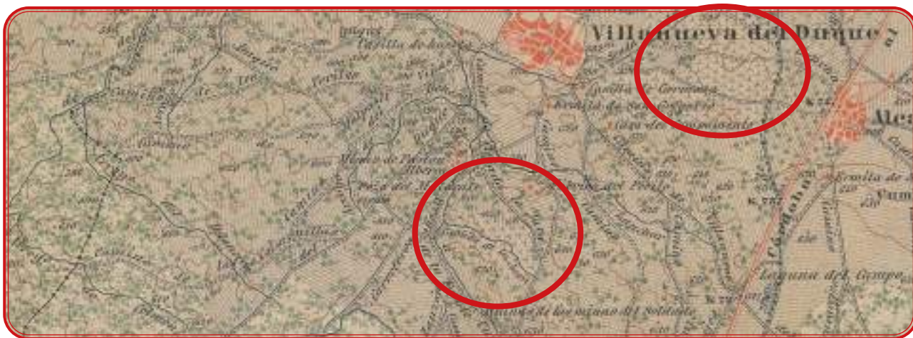
Sobre estas líneas, pagos del entorno del municipio. Por debajo, pago de Las Morras del Cuzna y de La Viñuela y Lagarejos, ambos entre Alcaracejos y El Calatraveño. Mapas de 1889.

Peñaladrones. Según las fuentes orales consultadas, la Huerta de Los Leones fue el sueño de uno de los delegados financieros de la Sociedad Metalúrgica y Minera de Peñarroya, de capital francés. Allí hubo un viñedo del que quedan restos vegetales, pero, sobre todo, en la enorme hacienda, aparece un lagar abandonado que debió ser uno de los más amplios de Sierra Morena. Se da la circunstancia de que la construcción data de la primera década del siglo XX, por lo que el viñedo debió plantarse después de la filoxera. La Guerra Civil y ciertas irregularidades contables de los promotores de esta hacienda hicieron que la finca pasara a la familia conocida como Los Leones, de Belmez, de ahí su nombre. Sólo la historia de este paraje merece una investigación propia por su singularidad.