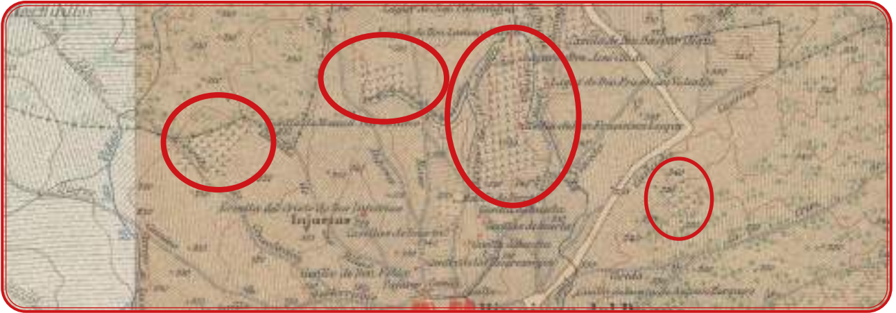
Pagos de viñedo al norte del término de Hinojosa del Duque. Bajo estas líneas, agrupaciones de viñedo y olivar hacia la zona sur del término. Y en la tercera foto, pagos de viñas cercanos a Encinosa. Mapas de 1889-1912.