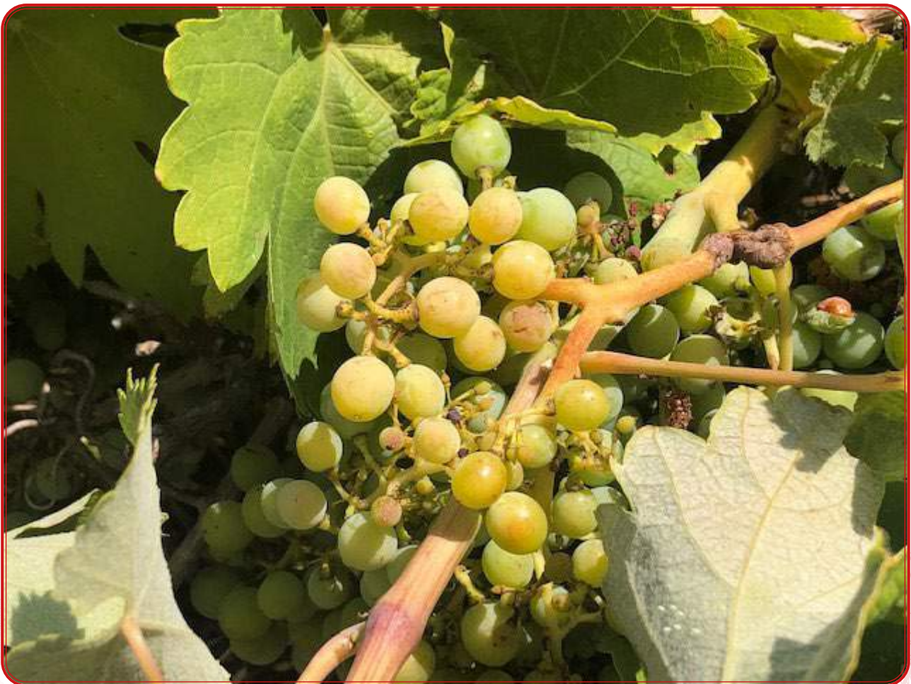
Cayetana blanca, en Pedroche.

- Cayetana blanca. Variedad blanca presente en Castilla La Mancha y Badajoz, de donde también es autóctona. Junto con la alarije constata la constante comunicación e intercambio de material vegetal desde Extremadura y La Mancha hacia Los Pedroches. La hemos encontrado en un viñedo centenario en Pedroche y en un lindero de Alcaracejos. Es una variedad que debió adaptarse muy bien en la comarca.