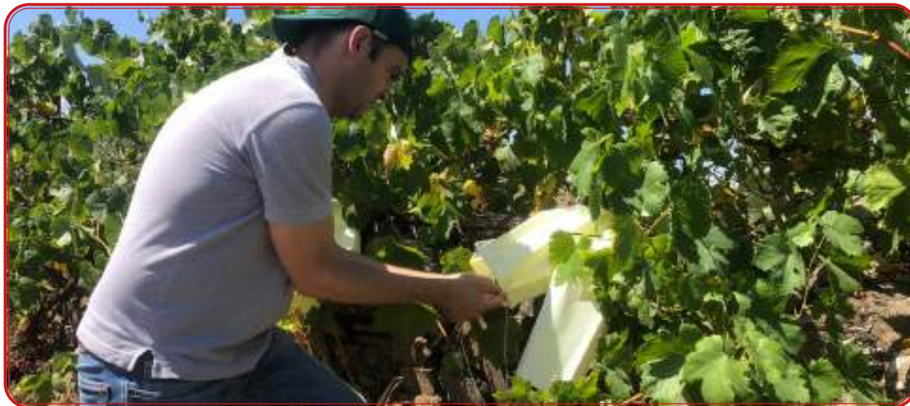
Protección de uvas y recogida de muestras en un lindero.