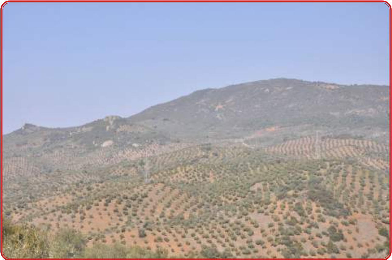
Olivares, monte y crestas de cuarcita en las faldas de la Sierra de la Chimorra.

Valle Buenestado diferencia varios componentes clave en la topografía de la comarca: la orientación noroeste-suroeste, una moderada altitud media, situada entre los 500 y los 700 metros en más de 70% del territorio comarcal; basculamiento hacia el Oeste, con lo que las altitudes van descendiendo de Este a Oeste, y la divisoria de aguas entre los ámbitos del Guadalquivir y del Guadiana, lo que representa todo lo contrario que supone la denominación Valle de Los Pedroches: esta divisoria traza un eje entre Hinojosa y Cardeña cuyo perfil es totalmente convexo. Los límites de la comarca están marcados grosso modo por dos ríos por el norte, Guadalmez y Zújar, y por una alineación montañosa por el sur, en la que destaca la cota de la Chimorra, que con 959 metros presenta la mayor altitud del norte de la provincia.