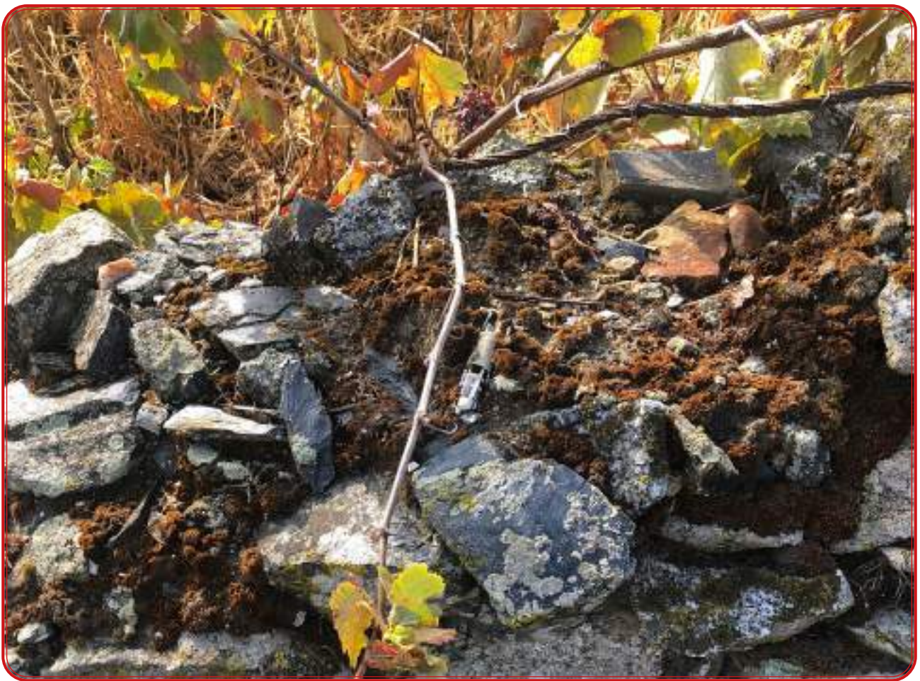
Vid protegida en una zona de intensa labor en Belalcázar.

Entre 2019 y 2020, el equipo de la Universidad Pública de Navarra, capitaneado por el profesor Santesteban, analizó 37 muestras de viñedos procedentes de parajes que albergaron un cultivo considerable: Llanos de Villaharta, Las Navezuelas, Ruedos de Pedroche y de Alcaracejos, Puerto Calatraveño, Nava de Vacas o Pedrique. De estas 37, nueve son plantas con perfiles genéticos únicos, a falta de continuar con el proceso de análisis y ampelografía. Pero el proceso no ha hecho nada más que empezar porque se siguen descubriendo vides en lugares apartados o aislados que se han conservado y que deben ser analizadas. Igualmente, queda pendiente una amplia prospección en el núcleo Hinojosa-Belalcázar, que se ha quedado fuera de esta primera fase intencionadamente precisamente porque el cultivo ha tenido continuidad y eso ha supuesto cierta colonización de la zona con variedades como la pedro Ximénez o la palomino.