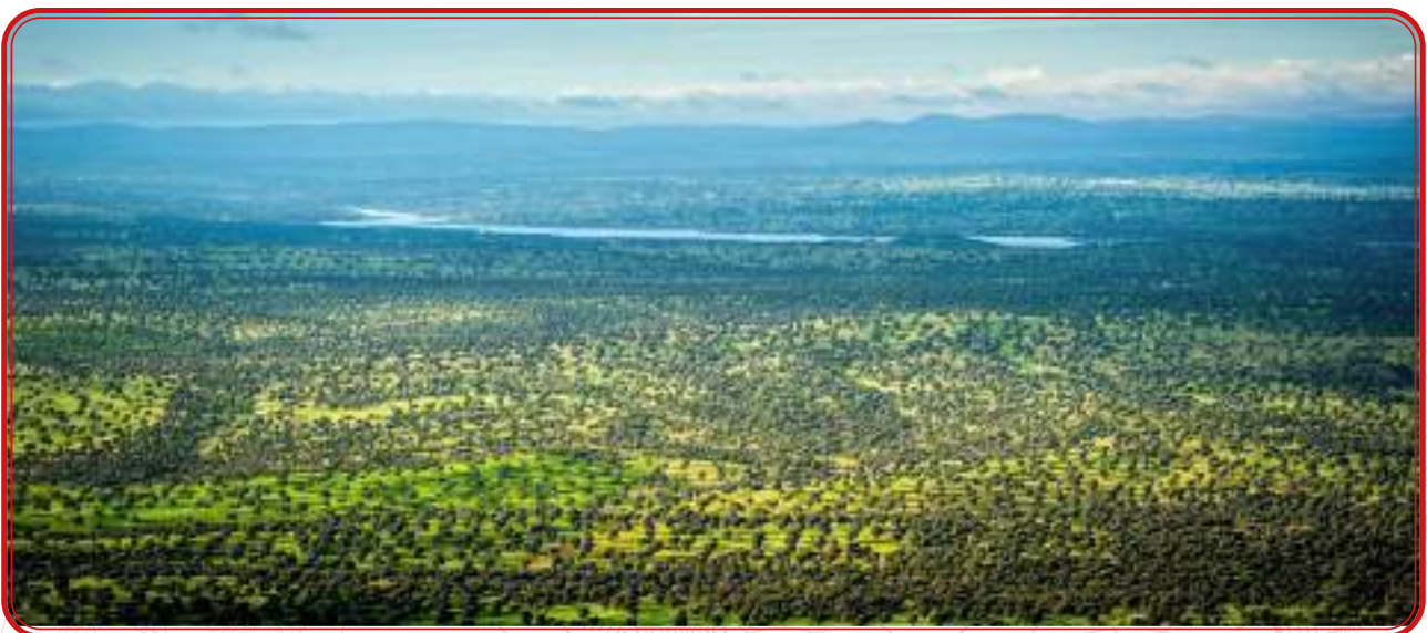
Vista de la Dehesa de Los Pedroches desde la Sierra de Santa Eufemia.

Los Pedroches es una comarca natural encuadrada al norte de Andalucía, entre las provincias de Córdoba, Jaén, Badajoz y Ciudad Real, con marcadas singularidades geográficas que la convierten en un espacio del ámbito de la Meseta aunque enmarcado de forma muy precisa en Sierra Morena. Según expone Bartolomé Valle Buenestado en su obra Geografía agraria de Los Pedroches , estudio de referencia para la materia que nos ocupa, “Los Pedroches se individualizan claramente del contexto de Sierra Morena porque constituyen un enclave granodiorítico de grandes dimensiones y de contorno preciso en pleno reborde de la Meseta”. El batolito de granito sobre el que se articulan los 3.612 kilómetros cuadrados del espacio comarcal abre el horizonte hacia Extremadura y las Sierras que bordean el citado batolito por el norte y por el sur marcan los límites con Ciudad Real, Badajoz, Jaén y con la Sierra Morena cordobesa. Esa circunstancia geográfica, que aporta unos límites precisos, ha marcado la historia comarcal y el carácter de un territorio de frontera, excéntrico, alejado de los grandes centros de decisión y relativamente autosuficiente en lo económico.