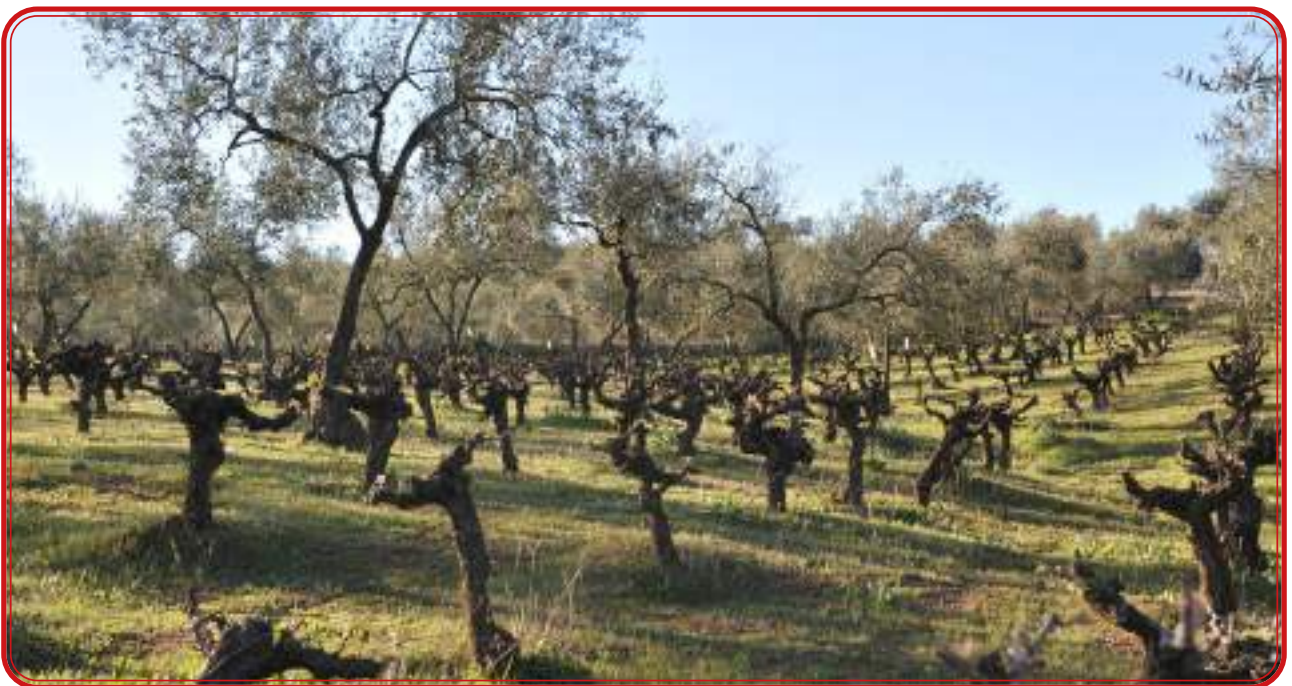
Viñas y olivos en Cazalla de la Sierra. Este paisaje evoca el cultivo en el pasado.

El cultivo de la vid es casi tan antiguo como la civilización. Algunos autores consideran que la viticultura en la Península Ibérica es anterior a la llegada de los Fenicios. Desde entonces hasta ahora el vino es parte fundamental de la cultura mediterránea. Aceite, vino y pan convirtieron a la Bética en la provincia más deseada de Roma. La denominada triada mediterránea ha marcado la historia de quienes han habitado en el entorno del Mediterráneo. El vino, como alimento primero y como elemento de ocio después, siempre ha estado presente. Y está en América porque la vid viajó en las primeras expediciones colombinas. La comarca de Los Pedroches es hoy una tierra sin vino. Queda algún reducto del pasado entre Hinojosa y Belalcázar, pero la cultura vitivinícola se ha perdido completamente. Ya casi no quedan ni fuentes orales que nos expliquen el pasado. Todo son recuerdos vagos. Quizá hayamos llegado unos 40 años tarde porque los últimos que conocieron el viñedo antes de la plaga de la filoxera, golpe final a las viñas de la comarca, murieron en los 80.