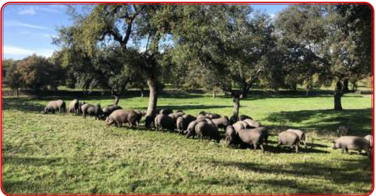
Cerdos en la dehesa de La Jara (Villanueva de Córdoba).

Fernando III El Santo gana Córdoba para los cristianos en 1236 y se produce la conquista de todo el norte de la provincia. Sabemos por distintos documentos las poblaciones que se incorporan a la Corona de Castilla, pero poco más con respecto al paisaje que se encuentra. Entre finales del siglo XIII y el siglo XV se genera un proceso repoblador que culmina con el surgimiento de la comunidad de las Siete Villas de Los Pedroches, la señorialización de Santa Eufemia y la creación del condado de Belalcázar, ya a mediados del siglo XV.