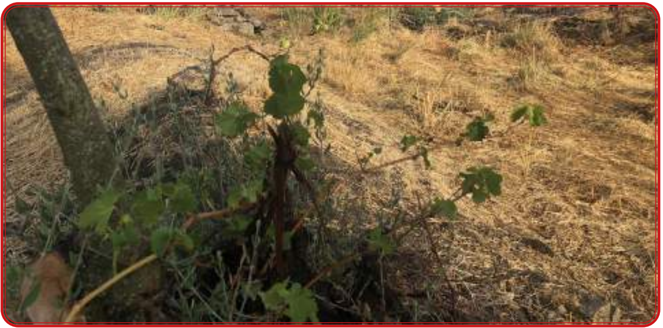
Restos de viñas en Villanueva del Duque. Sobreviven en la linde.