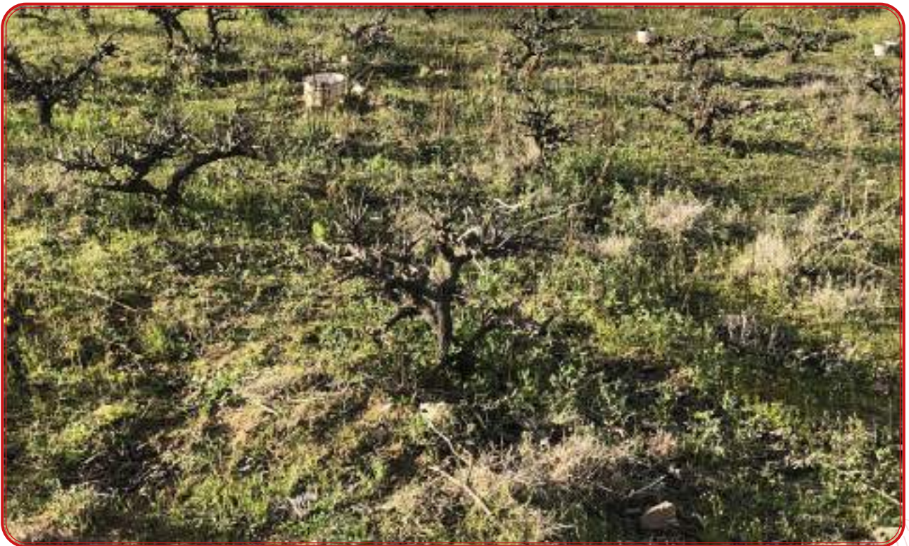
Viñas viejas sobre suelo de pizarra y cubierta vegetal.

Otros de los hándicaps que pueden presentarse en la comarca con respecto a los suelos para el cultivo de la vid van desde la compactación hasta la poca profundidad. Aunque la raíz de la vid es muy rústica, para su normal desarrollo y para una productividad óptima es necesario contar con suelos profundos y sueltos. La zona del batolito de granito es compleja por la poca profundidad del suelo y por la poca retención de agua; sin embargo, en las zonas de sierra donde la tierra es más arcillosa o en espacios de pizarra existe una mayor retención de agua pero la compactación puede complicar el cultivo. Es por ello que es necesario buscar espacios equilibrados y realizar tareas previas adecuadas a la plantación.