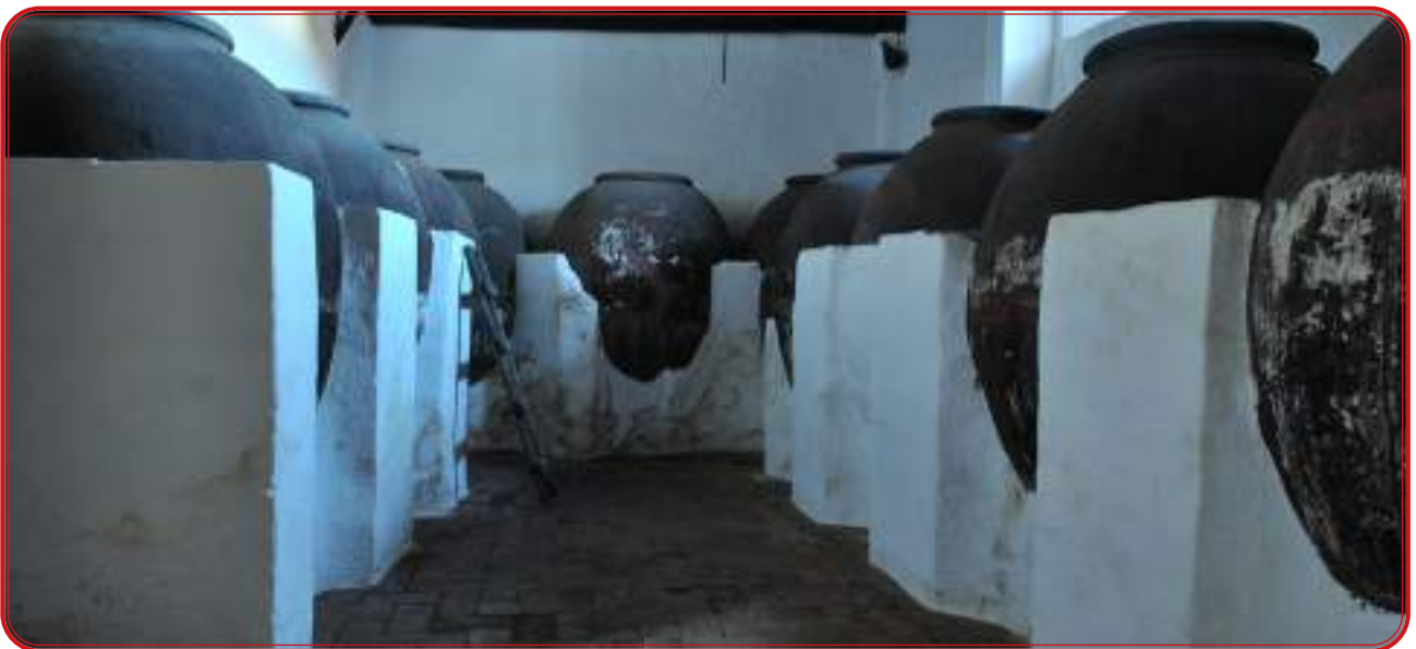
Lagar de la Sierra de Sevilla, similar a los que existieron en Los Pedroches.

La cercanía de Los Pedroches y del Valle del Guadiato con Extremadura ha mantenido viva la llama de la elaboración de los vinos de pitarra hasta hace pocas décadas a nivel casero, artesanal y en pequeñas cantidades, casi siempre para consumo de la familia. La forma de elaboración de este de vino es exactamente igual a la expresada anteriormente: estrujado, fermentación en la tinaja, prensado de la parte sólida y trasiego a otros recipientes durante los días más fríos del invierno para afinar sus condiciones finales.