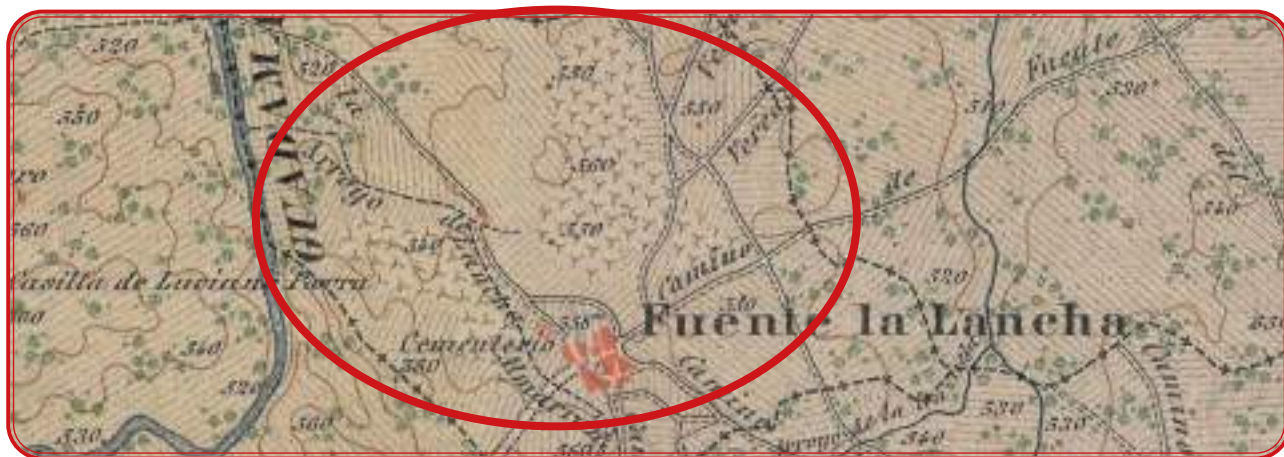
Viñedos entre Fuente la Lancha y Villaralto. Mapa del año 1889.