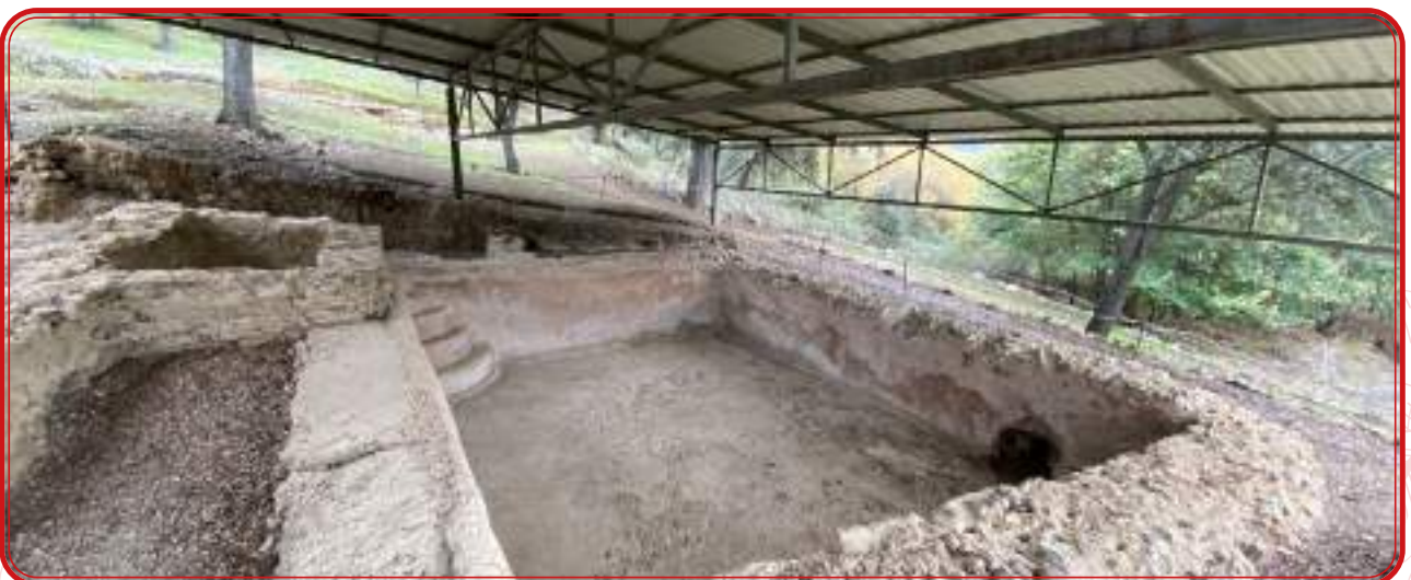
Yacimiento romano de Majadaiglesia, en El Guijo.

Tarteso fue el siguiente paso. Si bien no consta ningún yacimiento que pueda ser adscrito a este periodo, existen suficientes tesoros, como el de Los Almadenes, en Alcaracejos, o el de Belmez, que testimonian la riqueza minera y metalúrgica de la región norteña en estos tiempos. Que la introducen en esos cauces económicos. Los investigadores trabajan para demostrar que la intensa actividad de los filones mineros en este momento debió estar relacionada con las redes comerciales que los fenicios de la costa supieron introducir hasta aquí, como sucede en el ámbito del Guadiana y el Tajo. En ese contexto fenicio se incentivó el cultivo y la producción del aceite y el vino y se introdujo la gallina en el ámbito andaluz, señas de identidad de nuestros parajes singulares a lo largo del tiempo.