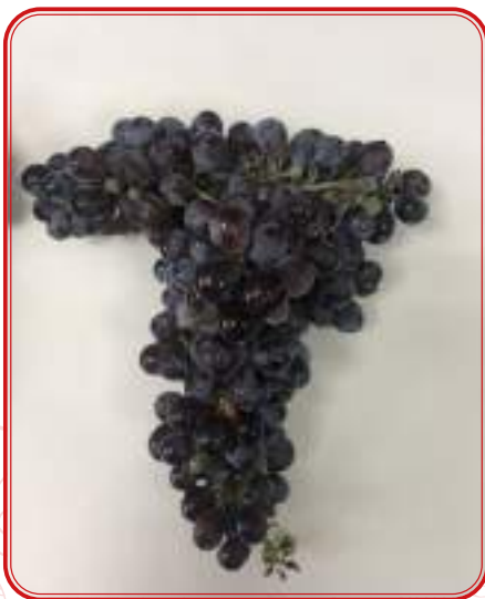
Racimo de variedad local de Los Pedroches en proceso de estudio.