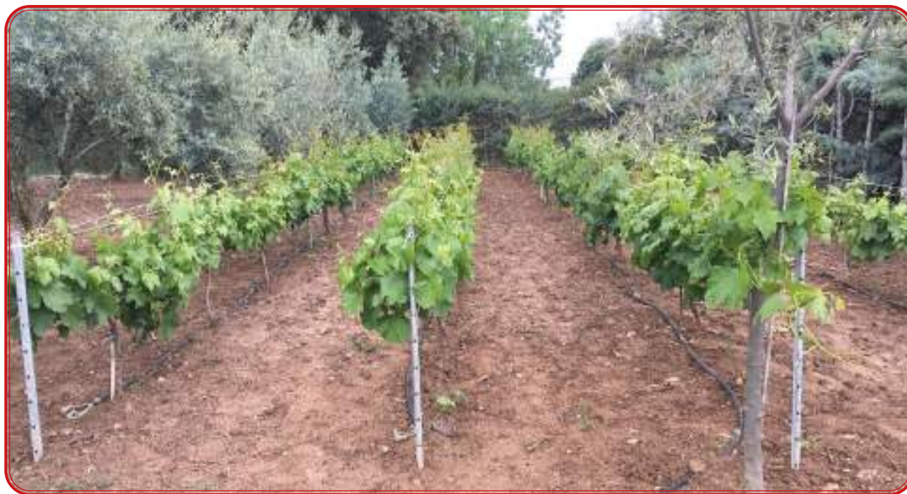
Plantación en espaldera de garnacha en Añora.

Como se apuntaba en apartados anteriores, más allá de los datos de extensión del viñedo en la comarca, que alcanza casi las 3.000 hectáreas en su punto álgido y de la normativa con la que se regulaba el vino por parte de los concejos, el destino de autoconsumo, la falta de una industria y de una cultura de elaboración desarrollada, nos impide contar con fuentes que nos presenten de forma concreta qué variedades se cultivaban, cómo se elaboraba el vino, qué rasgos tenía ese caldo. Sí existen, no obstante, textos y documentos puntuales que nos pueden ayudar a reconstruir parte de ese pasado vitivinícola de la comarca.