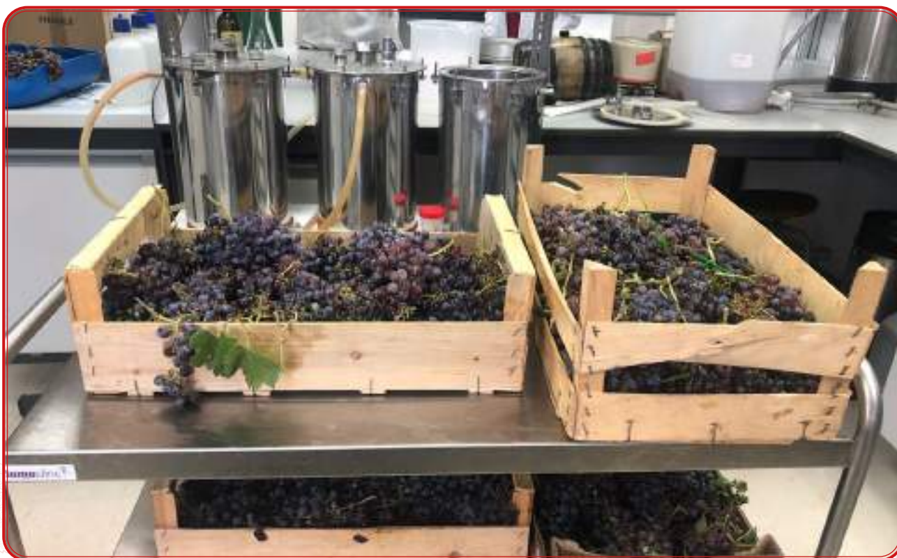
Uvas amparo antes de su vinificación en 2019

La recuperación de las variedades cultivadas antiguamente en el Valle de los Pedroches representa una oportunidad para aumentar la sostenibilidad y la resiliencia de la población en esta zona agraria, especialmente sensible al cambio climático.