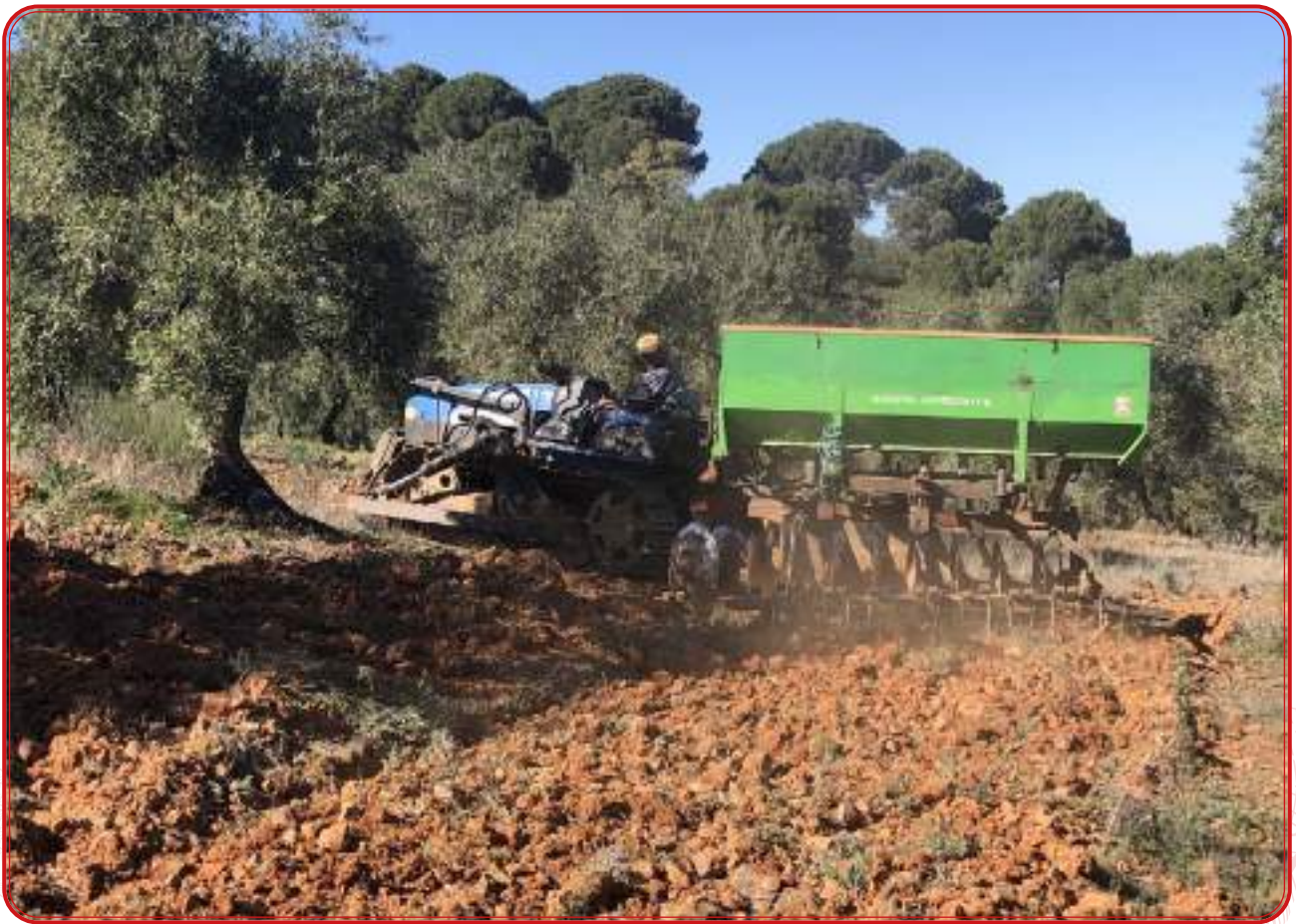
Preparación del terreno para una nueva plantación de viñedo.

En principio, y según los análisis de suelos con los que contamos, existen zonas muy aptas para la plantación del viñedo en la comarca. Y no sólo eso, sino que el clima y la altitud de Los Pedroches son modélicos para el desarrollo del cultivo.