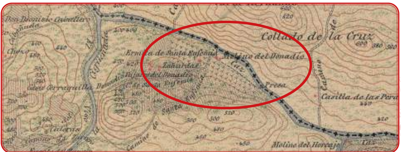
Mapa del viñedo del Donadío, junto al Guadalmez, en Santa Eufemia. Año 1873.