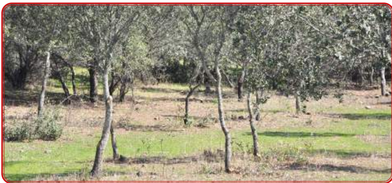
Tarea de adehesado tras un desmonte en Los Pedroches.

El progresivo aumento de la población de la comarca, al igual que describe Domínguez Ortiz para otros territorios de Castilla, constituye una de las razones por las que se incrementan las roturaciones en las zonas más montuosas de la comarca. Y con las roturaciones llega el cultivo de leñosos. En realidad, las roturaciones de los baldíos y terrenos comunales fueron frecuentes hasta finales del siglo XX. Los vecinos de municipios como Pozoblanco, Alcaracejos o Villanueva de Córdoba solían ir a la Sierra y a la franja de suelo de roca metamórfica, conocida como serrezuela, jarales o la pizarra a rozar y sembrar mediante quemas controladas y desbroces. Esas siembras se realizaban cada cierto tiempo y se iban rotando. Pero con el crecimiento de la población, aumentó la presión sobre las tierras más alejadas de los municipios y estas se pusieron en cultivo de forma progresiva. Así creció el viñedo comarca, circunscrito desde finales de la Edad Media a los ruedos de las poblaciones y extendido en la Edad Moderna a las zonas de Sierra.