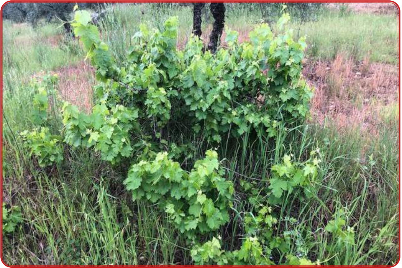
Vid de la variedad alarije en la zona del Cerro del Cohete de Hinojosa.