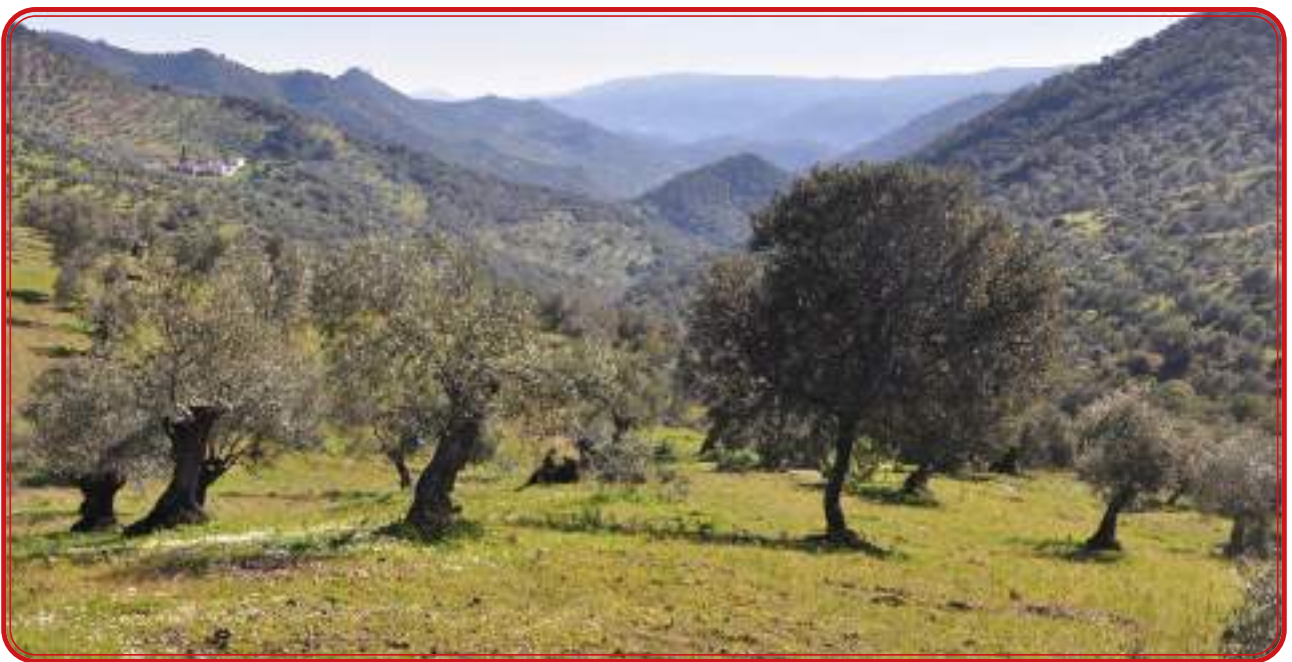
Vista del entorno de Pedrique y el Cañaveral, con importantes viñedos en el pasado.

Luis Ramírez de las Casas Deza, en su Corografía Histórico-Estadística de la provincia y obispado de Córdoba , aborda la situación del viñedo en el primer tercio del XIX, ya que la obra citada data de 1840, y hace referencia de forma continua a que en los municipios de la comarca hubo más viñas en otro tiempo, a que el cultivo va dejando paso al olivar o a que los vidueños que quedan son poco productivos o se están abandonando. Casas Deza nos dice que “en los territorios septentrionales de la sierra (Los Pedroches) abundan las encinas y en los meridionales los olivos. Para hacer plantíos de estos se han ido arrancando las viñas en muchas partes, si bien por otras se van poblando de ellas varios desmontados”. De esta cita podemos concluir que el arranque de viñedo fue masivo, aunque nos cita el autor la plantación de viñedo en otros desmontados, algo que debió ser muy puntual porque a lo largo de la obra solo se cita la plantación que se realizó en la zona del Alcanfor (en la solana del Calatraveño) en el siglo XIX. Hemos de tener en cuenta que la condición para desarrollar las roturaciones en los baldíos se substanciaba en la plantación de cultivos leñosos como lo es la vid, aunque el olivar fue sin duda el cultivo preferido.