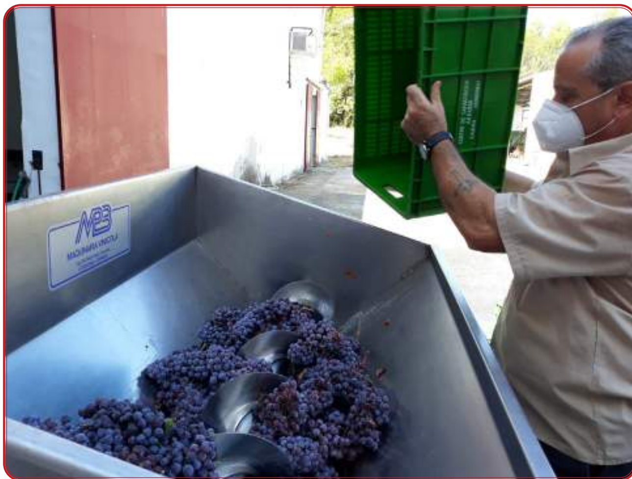
Tolva de recepción en el Ifapa de Cabra. Cosecha 2020.

El 24 de Agosto de 2020 se recibieron 30,9 kg de uva, los racimos fueron seleccionados eliminando los que tenían bayas demasiados grandes e inmaduras, de tal forma que nos quedamos con 27,5 kg de uvas totalmente sanas y en adecuadas condiciones para su vinificación. Se conservaron en cámara frigorífica a 4°C hasta el día siguiente en que se procedió a iniciar una vinificación de vino tinto clásica.