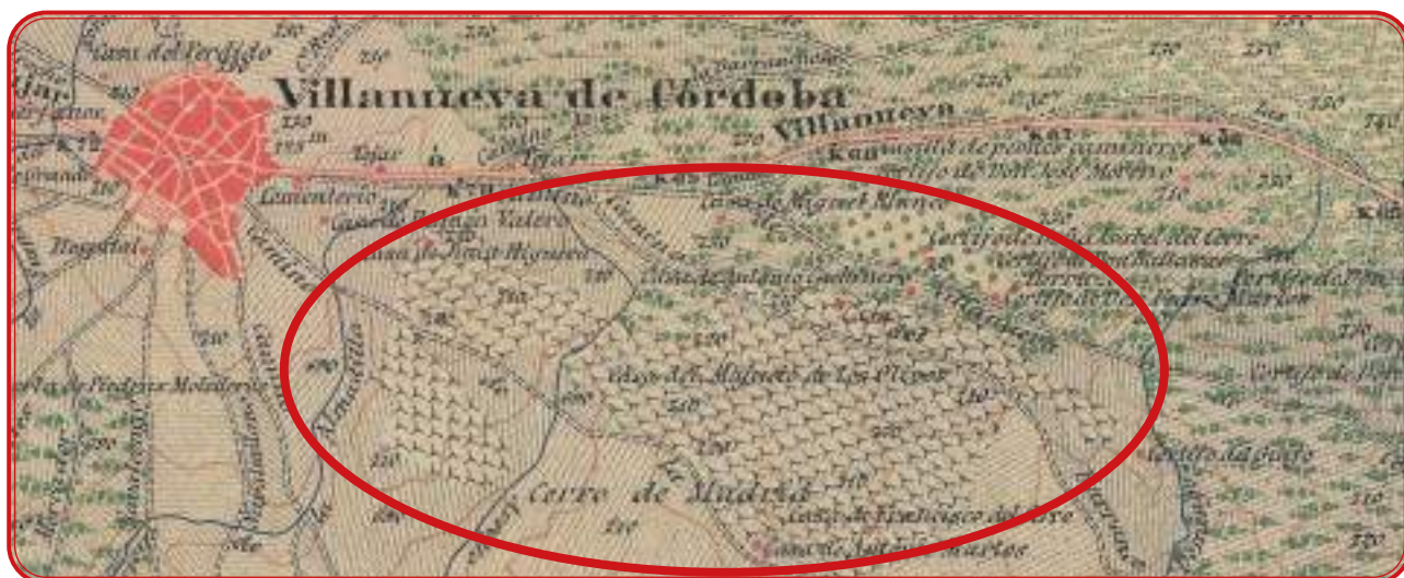
Viñedos de Villanueva de Córdoba a finales de siglo XIX. También contó con algún pago de viñas en la zona de la Sierra.

La localidad de Villanueva de Córdoba contó hasta primeros del siglo XX con un viñedo que en las décadas anteriores a la filoxera debía alcanzar las 140 hectáreas, según la estimación realizada sobre las minutas cartográficas de 1890. La mayor parte de este viñedo se encontraba en la zona sur de lo que hoy es la carretera de Cardeña y, según testimonios orales recogidos en el municipio, las últimas viñas arrancaban casi desde los patios traseros de las casas. De hecho, la calle Parralejo, que hoy queda casi en el centro del casco urbano, confinaría entonces y sería un acceso a los pagos de viñas de la zona referida. Casas Deza habla de que Villanueva de Córdoba produce vino que bastaría para surtir a la población medio año; el resto se llevaba desde Montilla, algo que ya es muy frecuente en otros municipios de la Sierra. Una de los documentos que hemos utilizado para este apartado es la Memoria sobre el estado actual de la agricultura, industria rural y ganadería de la provincia de Córdoba , de Juan de Dios de la Puente y Rocha. Aquí se nos presenta que la extensión de viñedo de Villanueva de Córdoba en 1875 es de 786,26 hectáreas, algo que sin duda no era así. La justificación de este dato se debe sin duda a que en 1875 los términos municipales de Los Pedroches se encontraban en proindiviso y bajo el epígrafe de Villanueva se incluye el viñedo de las Siete Villas, cuya extensión de viñedo debería rondar esa cantidad aproximadamente según las fuentes consultadas.