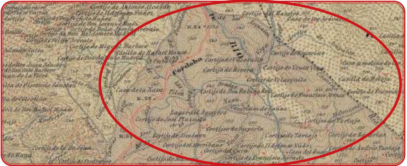
En la imagen superior, zona de La Nava, en término de Espiel pero muy vinculada a Pozoblanco. Abajo, Llanos de Villaharta, junto a este municipio pero término de Pozoblanco. Mapas de 1871. En las fotos de abajo, tinajas de fermentación en el cortijo del Llano del Platero, junto al Cuzna. Al lado, cierre de tinajas encontrado en un viejo cortijo junto al Guadalbarbo.