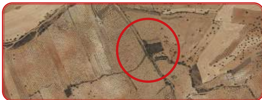
Arriba, zona de la Patuda con viñedo y olivar a finales del siglo XIX.. Abajo, la zona del Cerro del Cohete, con viñedo en el pasado, con olivar hoy.