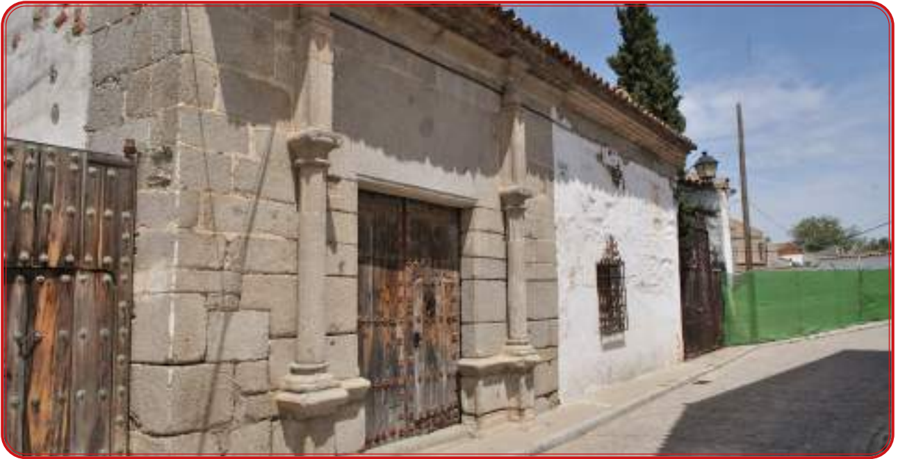
Posada antigua del Moro, venta situada muy cerca de la zona conocida como La Tercia, antiguo lagar comunitario de Torrecampo.