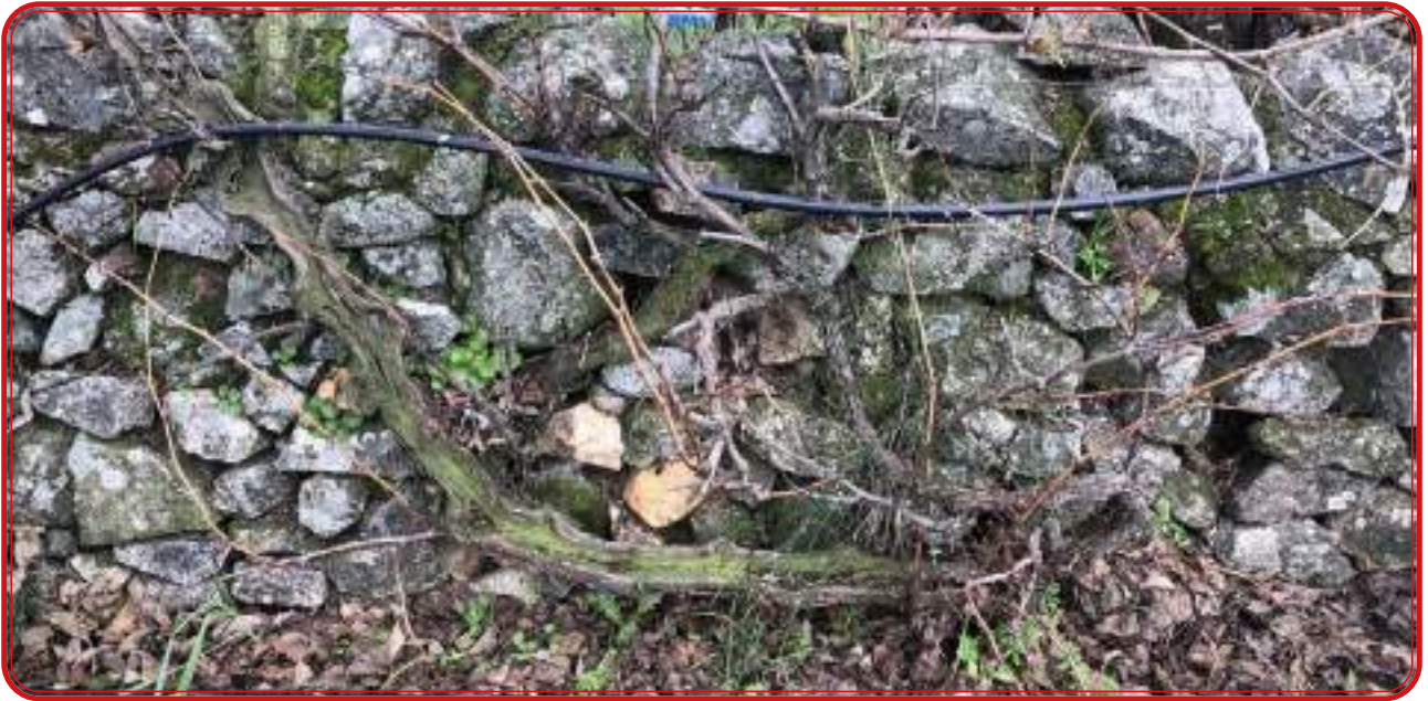
Viña centenaria tinta por identificar junto al Guadarramilla. Término de Alcaracejos.

Sobre el cultivo de la vid y la elaboración del vino en Alcaracejos, Casas Deza expresa que “en otro tiempo, el plantío de vides, que han venido a mucha disminución, era más numeroso”. Sobre la calidad del vino, el autor lo define como “bastante bueno”.