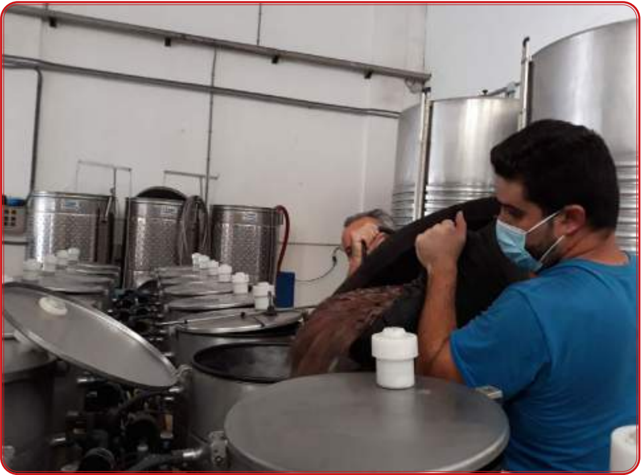
Trasiego y fermentación en el Ifapa de Cabra. Cosecha 2020.