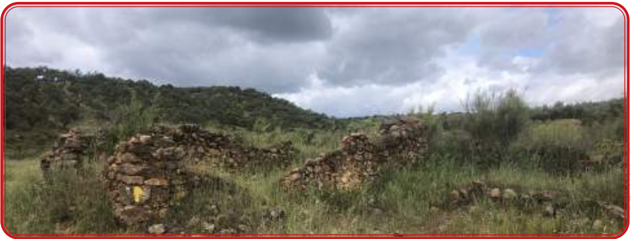
Restos de las cuadras de la Venta de Vegas, en El Alcanfor.

“A principios del siglo pasado, y como a mitad de camino entre Pozoblanco y Obejo, en uno de los pliegues de Sierra Morena, sobre un pradillo fértil próximo a un olivar, se levantaba un ventorro denominado de la Sangre. Su nombre procedía de una colisión sangrienta habita allí en tiempo de la francesada entre dragones y guerrilleros. El terreno donde se asentaba el ventorro era un rasillo siempre verde limitado por altas chumberas próximo a un barranco, y cercano a un olivar, en el cual se advertían ruinas, vestigios de fortaleza y atalaya. Este terreno pertenecía a un lugar metido en los más áspero y quebrado de la sierra, y su nombre ahora no hace al cuento. No era el ventorro muy grande ni espacioso; no tenía calidad de parador, ni aun siquiera de venta. Su fachada, de cinco a seis metros de larga, enjabelgada de cal y agujereada por la puerta y tres ventanucos, daba a un mal camino de herradura sembrado de piedras sueltas; su tejado terrero se torcía hacia el suelo y se unía al de un cobertizo, en donde se hallaban las cuadras, el pesebre y el pajar. Se pasaba la puerta de entrada del ventorrillo, en cuyo dintel colgaba un manojo de sarmientos, lo cual indica, para que usted lo sepa, que en un casa así adornada se vende zumo de uva, y se entraba en un zaguán miserable que era, además, cocina, despensa y a las veces dormitorio”.