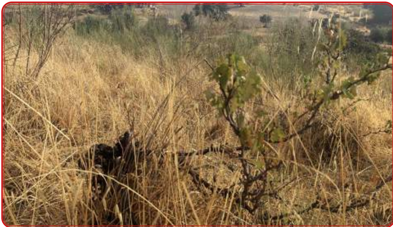
Vid centenaria, como se observa por el grosor del tronco, en Villanueva del Duque.

100 fanegas, se siembran de cereales por tener muy pocos pies”; en el Guijo las, las viñas han sido destruidas para dedicarlas al cultivo de cereales y en Fuente La Lancha “el cultivo ya es muy poco significativo por dedicarse el terreno al cultivo de cereales”. Sobre la zona de Hinojosa del Duque, que en la época tenía más de 1.000 hectáreas de viña registradas, se dice que “las viñas están plantadas en terrenos muy arcillosos y secos y de poco fondo en los cuales las vides prosperan muy bien hasta los 20 años, pero pasado este tiempo su producción es escasa y como tienen más de 50 años el producto es muy poco”.