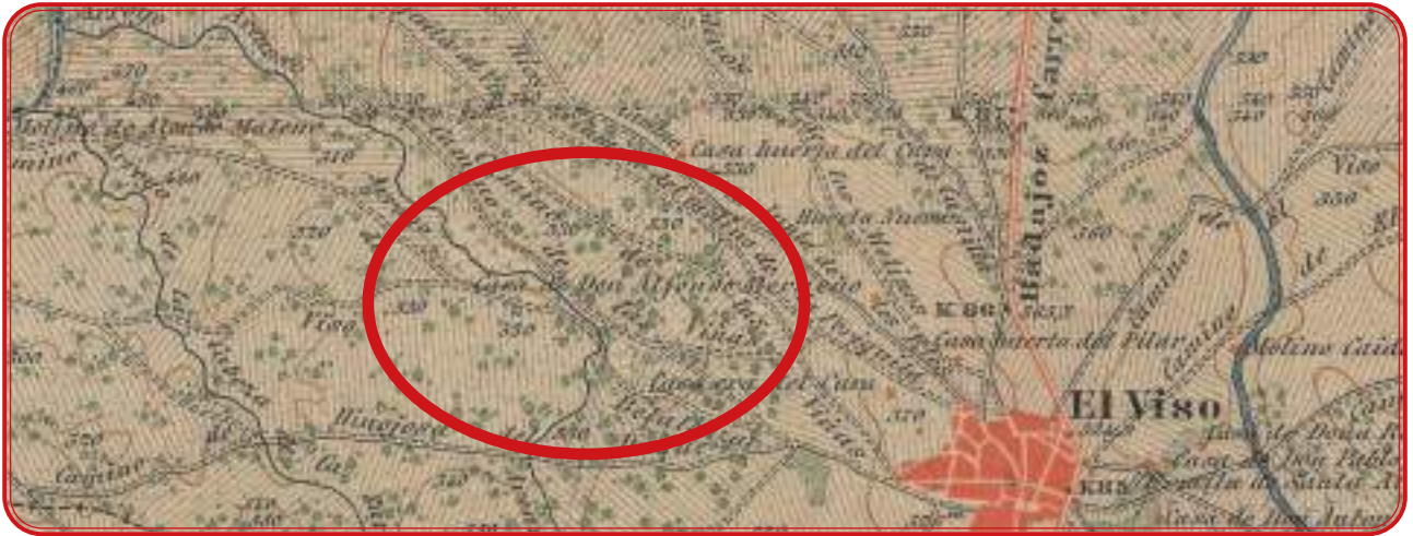
Arriba, Camino de las Viñas. Abajo, pago ubicado en dirección a Dos Torres. Año 1873.

Los viñedos de El Viso se situaban en torno al actual camino que conduce a la presa de La Colada y en la salida de la carretera hasta Dos Torres. Pero las referencias del cultivo en el municipio son escasas, más allá de testimonios orales que se refieren a un cultivo escaso, con pagos aislados y centrado en el autoconsumo. Casas Deza lo referencia como una “corta producción de vino y de poca duración”. En Santa Eufemia, el viñedo más destacable se encontraba en la zona del Donadío.