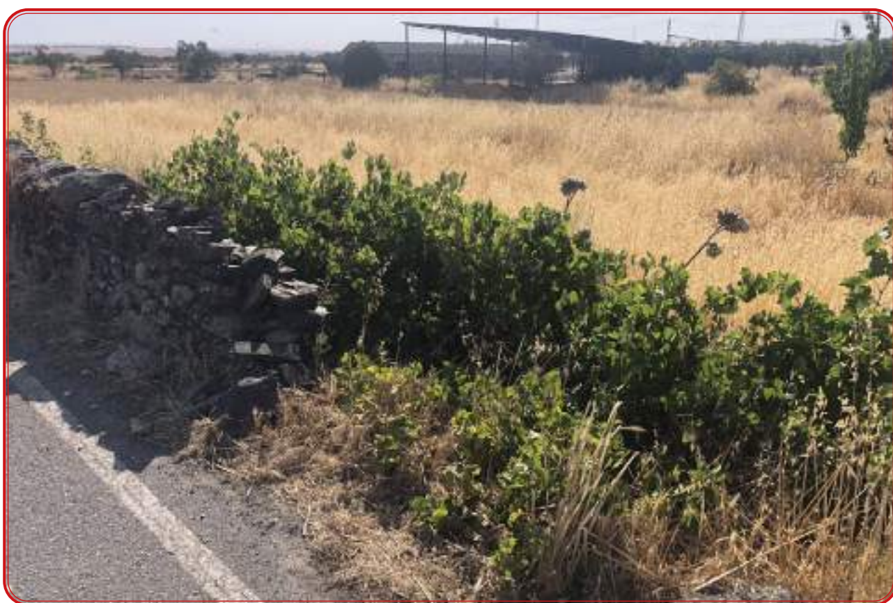
Vides de variedad local amparo en un lindero en la zona granítica de la comarca.

La viña es prácticamente inexistente en el paisaje de Los Pedroches. Como hemos abundado con suficiencia en distintos epígrafes de este trabajo, sólo quedan pequeños reductos en Hinojosa y en Belalcázar, pero en el resto de la comarca no hay vides, sino emparrados y linderos poblados de esta planta que crecen sin orden ni cuidados. Tras la paga de la filoxera el cultivo se abandonó casi por completo y recuperarlo se muestra como una labor prácticamente imposible. Pero existen elementos para la esperanza, sobre todo por la posible aparición de variedades únicas prefiloxéricas que han permanecido a salvo en esos emparrados, en esos linderos. Y ahí hemos llegado después de varios años de investigaciones y con una metodología que ha evolucionado en los últimos tres años. Con el hándicap que suponía el desconocimiento más absoluto sobre ampelografía, el campo de la botánica al que concierne la identificación de las variedades de vid, aplicamos suficientes dosis de sentido común y de conocimiento del territorio para poder conseguir el objetivo de identificación final de variedades desconocidas.